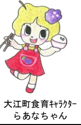
大江町食育キャラクター らあなちゃん