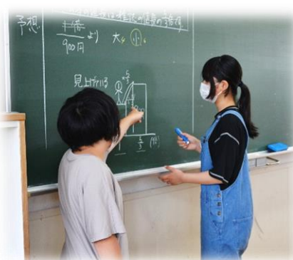
自分の考えを友達に説明して、授業を進める6年生