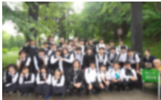
3日目 平泉中尊寺 (平泉町)