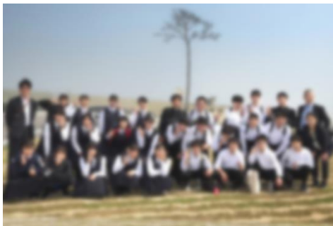
1日目 高田松原津波復興祈念公園 (陸前高田市)