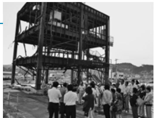
▲震災の傷跡に強い衝撃を受ける

また、訪れた復興商店街では、復興に向けて少しでも力になればと両手に大きな荷物を抱えるほど、たくさんのお土産を買う参加者が多く見られました。