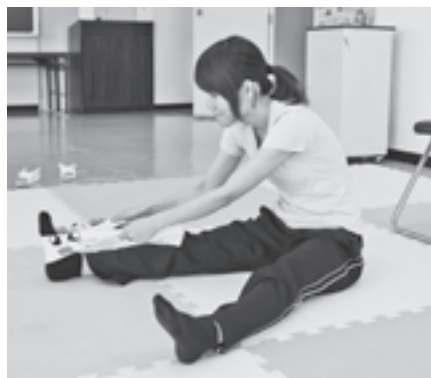
④ タオルの両端を持ち、足をかけてももとおふくらはぎをよく伸ばす