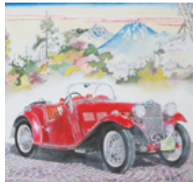
1935 SINGER 7区 西村昭信