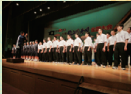
大江中学校2年生による混声3部合唱