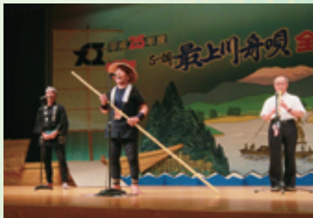
どの出場者も優勝を目指して力いっぱい歌いました