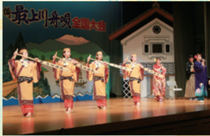
北海道江差追分と追分踊り