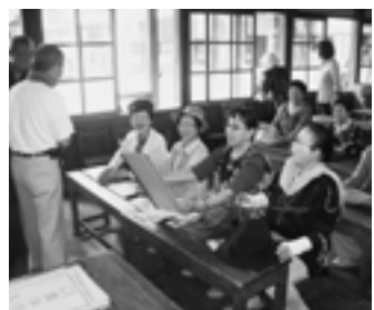
みやぎの明治村にて懐かしの木造校舎▶

◆わだいの交差点に掲載できなかった情報の一部は、町ホームページの「フォトおうえ」に写真を掲載していますのでご覧ください