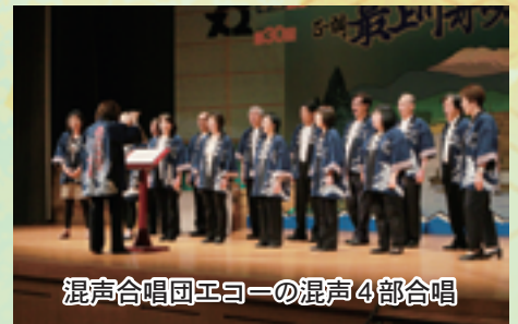
混声合唱団エコーの混声4部合唱