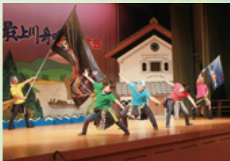
舟唄ヒップホップダンス