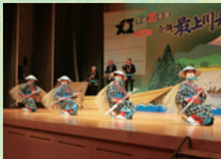
正調最上川舟唄・舟唄踊り