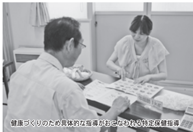
健康づくりのため具体的な指導がおこなわれる特定保健指導

健康に良いとされる食事の考え方 として「一汁三菜」(汁物1品とおか ず主菜1品+副菜2品)があります。 主食は、脳の活動に必要なブドウ糖