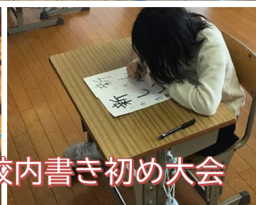
1/10 校内書き初め大会

地域の皆様、新年あけましておめでとうございます。今年もどうぞよろしくお願いたします。