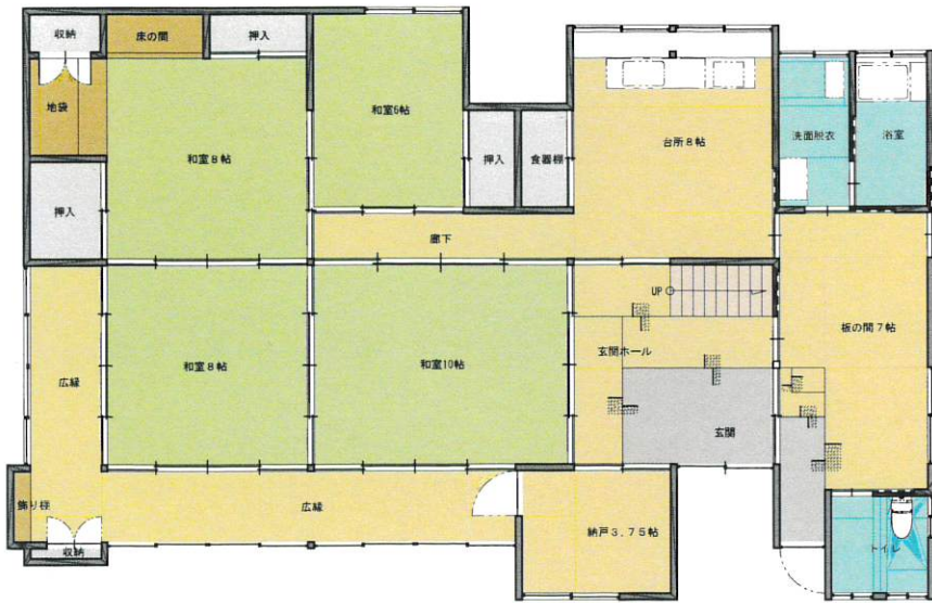
1階平面図 160.4m 2