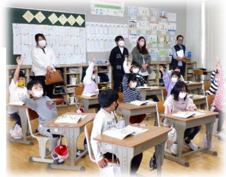
【子ども達の学習の様子】

11月22日(水)の3・4校時(10:45~12:20)は本校の学習公開日になっています。保護者の皆様はもちろん、ご家族や地域の方はどなたでもご来校いただくことができます。普段なかなか学校に来る機会がない方も、是非子ども達の学習の様子をご覧くださいたくご案内申し上げます。