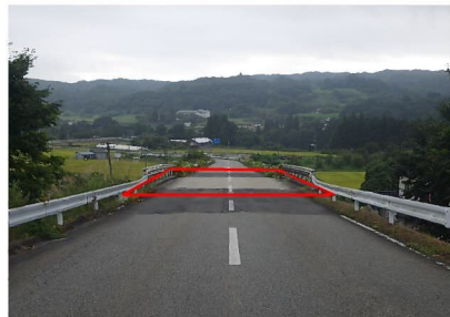
町道諏訪堂中山線