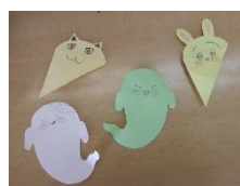
アイデアいっぱいの 手作りしおり

11月5日～11月28日まで図書委員会企画の「読書まつり」を開催しています。みんなに本を好きになってほしいという思いを、どんな形で伝えようかと考え、今年は「読書の山登りカード」を使って、20冊に到達したら「しおりをもらえる」30冊に到達したら「ブックカバーで作ったものをもらえる」という企画となりました。2か月前から準備を進めていたこの企画。図書室には、たくさんの児童が本を選びに来ています。