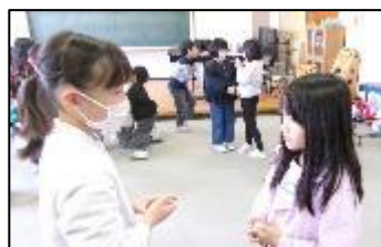
3年生：外国語活動の学習

10月から、1～3年生が令和10年度からの統合を見据えた学習交流を始めました。はじめはドキドキしていた子ども達ですが、帰るころには「今度いつ会える？また一緒に遊ぼうね。」と打ち解け合った会話が出るほどになっていました。左沢小の皆さんも、スクールバスの見送りに外まで来てくれて、涙ぐみながら手を振ってくれる姿も見られました。これからも、様々な交流を進めていきます。