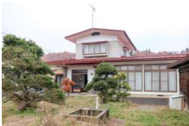
↑ 庭側から見た母屋