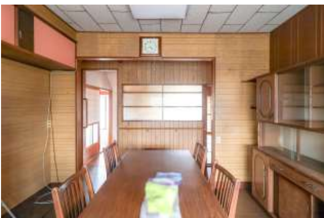
↑ キッチンから茶の間向け和室を見た様子