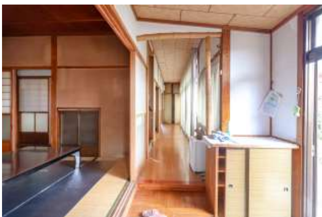
↑ 廊下の突き当りには収納があります