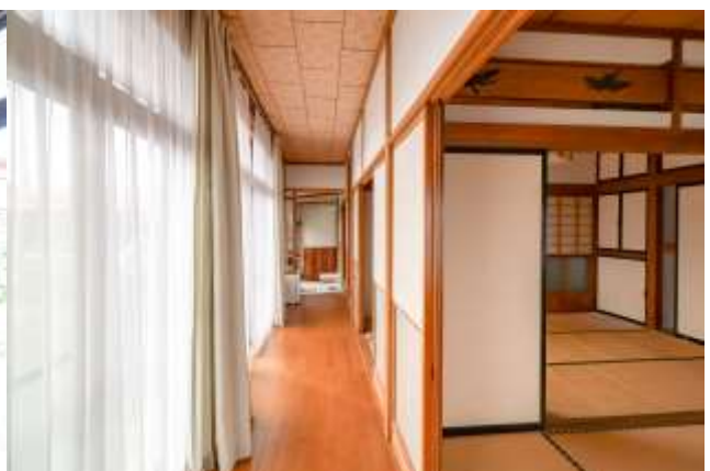
↑ 廊下突き当りから玄関側を見た様子