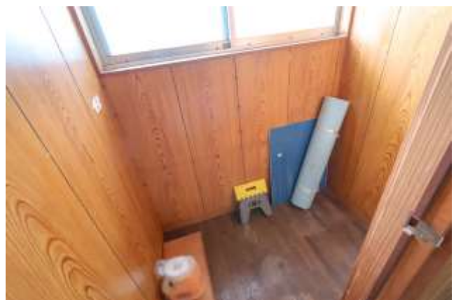
↑ 隣は物置です。掃除用具など置くのにピッタリ