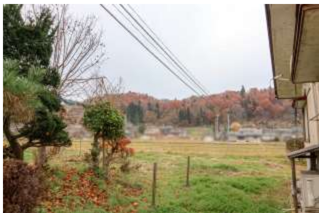
↑ 周囲は田んぼ、離れた所に国道と山が見えます。