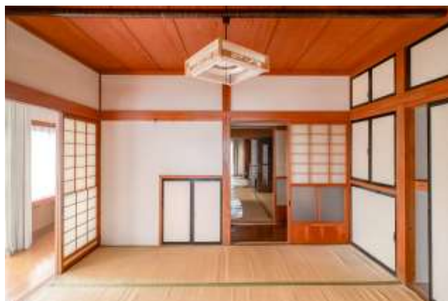
↑ 写真左：階段下に収納があります