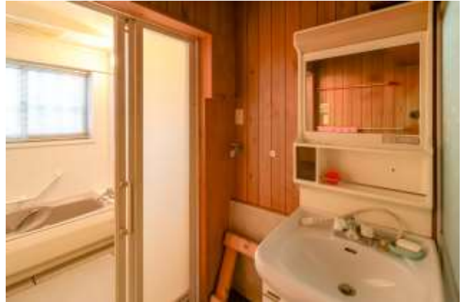
↑ 洗面所と洗濯機置き場