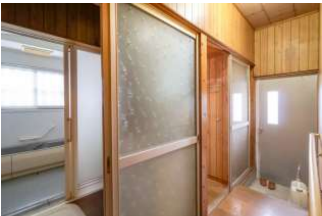
↑ レトロな模様入りのガラス戸