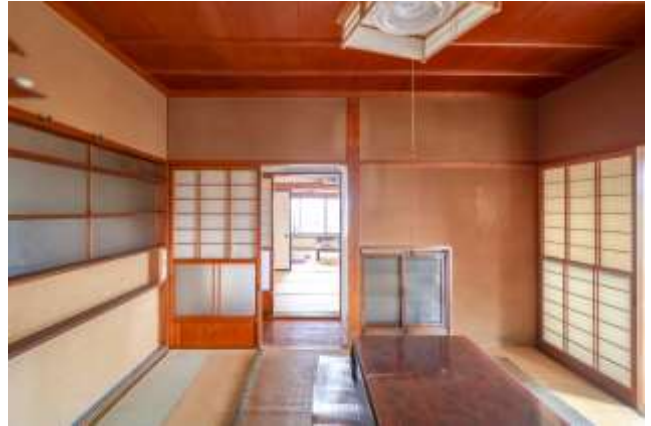
↑写真右：階段下に収納があります。