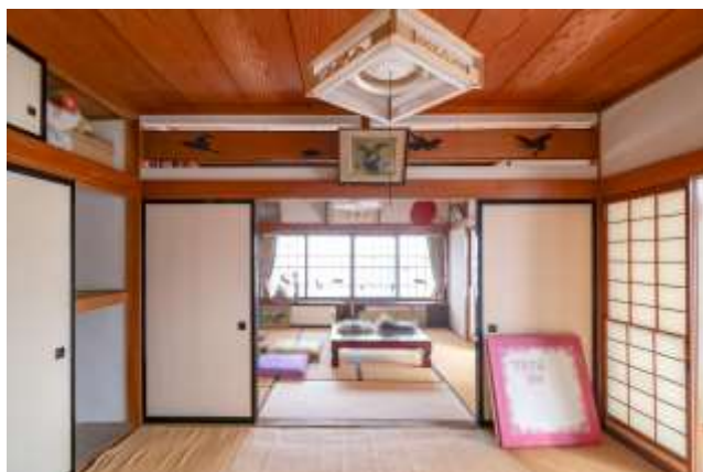
↑ 階段横和室から、奥の間を見た様子

奥の間も、窓が大きいので開放感があり広々としています。こちらの二部屋は比較的劣化も少なめで状態が良いです。