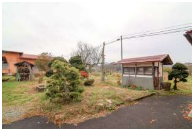
↑ 写真右：外トイレだった建物