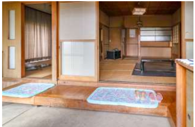
↑ 玄関をに入って正面、茶の間向け和室