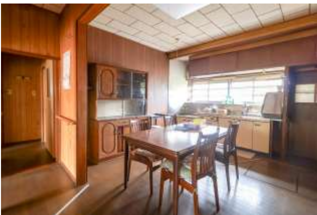
↑ キッチンの横に勝手口

ダイニングテーブルとチェアも置ける広いキッチン。窓がーか所なので、日中でも少し暗めです。壁の色を明るい色に変えるなど、手を加えれば雰囲気ガラッと変わりそう。