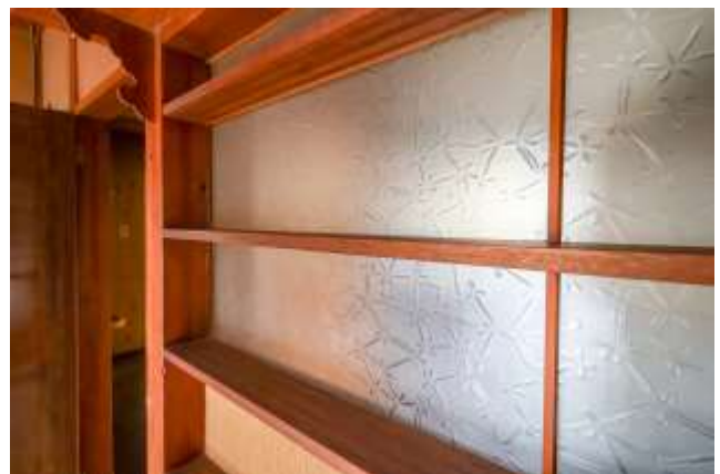
↑光取り窓。木枠が棚のようになっています