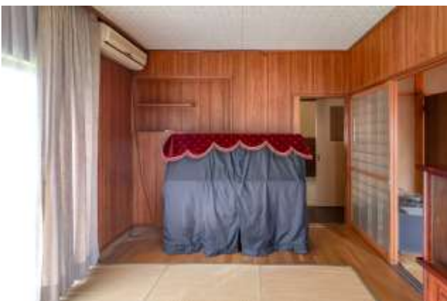
↑南側の窓から日の光が入り明るいです