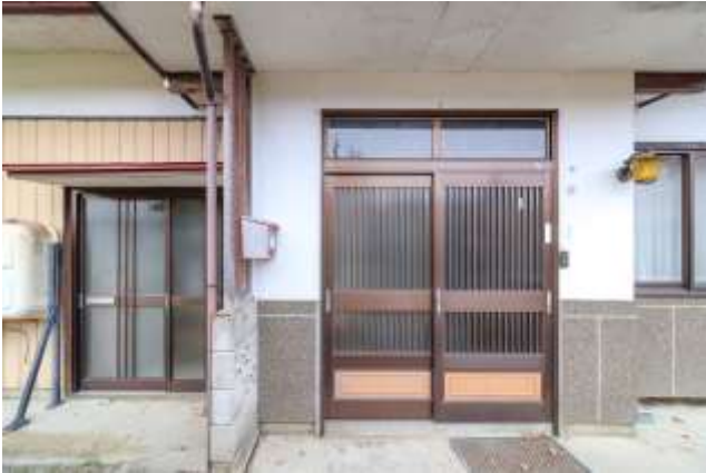
↑ 玄関（左はサブ？玄関）

玄関を開けると、正面に茶の間向け和室。左側にはサブ（？）の玄関。右側には廊下が続いています。廊下の片面はガラス戸なので、カーテンを開けると自然光が入ります。