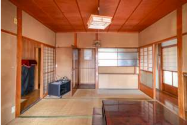
↑正面の扉はキッチンに繋がっています。