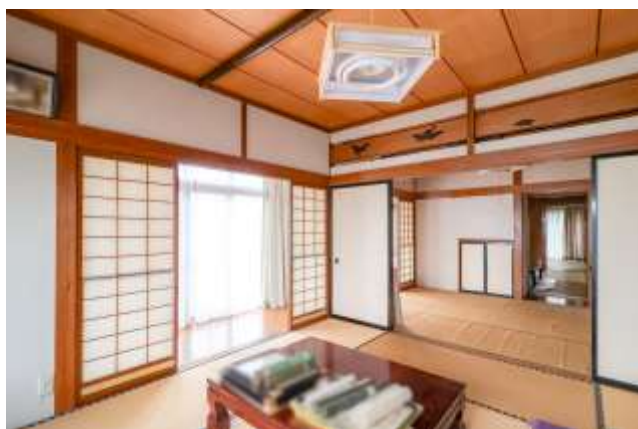
↑ 奥の部屋。写真ではお仏壇が有りますが、現在は撤去済みになっています