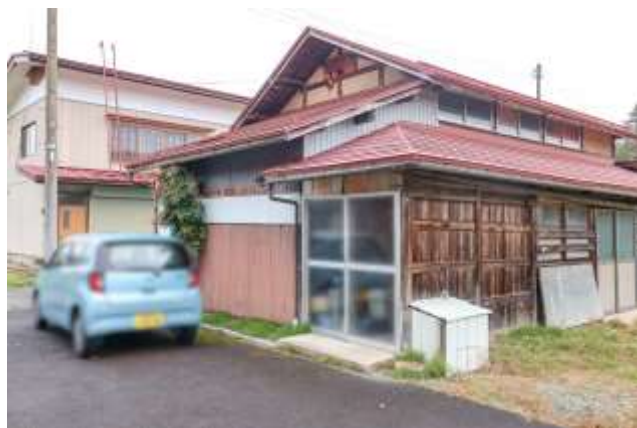
↑ 小屋（こちらはお片付け中）