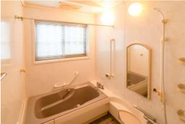
↑ 白基調のユニットバス