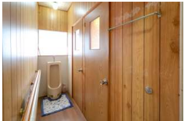
↑ 右奥側のドアが洋式トイレ、手前が物置です