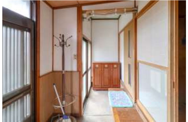
↑ 玄関をに入って左側