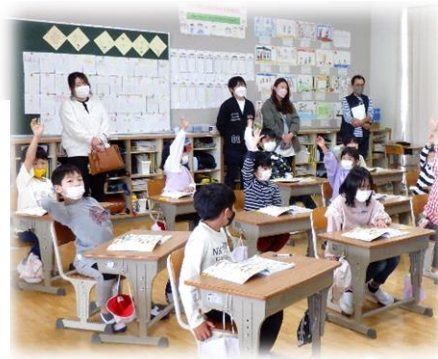
【子ども達の学習の様子】

11月22日(水)の3・4校時(10:45~12:20)は本校の学習公開日になっています。保護者の皆様はもちろん、ご家族や地域の方はどなたでもご来校いただくことができます。普段なかなか学校に来る機会がない方も、是非子ども達の学習の様子をご覧くださいたくご案内申し上げます。