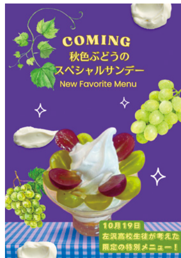
左沢高校2年次 探究授業

10月23日には大江中学生の総合学習「大江町未来創造計画 大江中生の日in道の駅おおえ」が開催されました。10年後も住みやすい大江町を作るため、生徒たちが10班に分かれそれぞれ考えたアイデアを道の駅おおえで実現しました。大江町の良い所を紙に書いてもらうメッセージアートの実施や、地域の幼稚園児との交流をしていた班もありました。店内でスタンプを集めて回るスタンプラリーの開催などもあり、中学生たちのアイデアが光りました。また店内外問わず