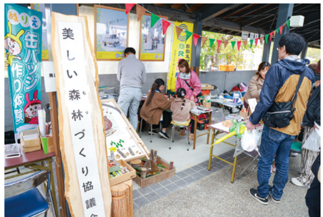
図1 木育を知っていますか?

大江町の秋の一大イベント「おおえの物産味覚まつり」。令和7年11月9日(日)に左沢駅前広場で開催され、「美しい森林(もり)づくり協議会」のブースに参加しました。出展では大江町型住宅模型の展示、新企画の子供を対象とした木工クラフト、木や葉、どんぐりを使ったゲームを行い、たくさんの子供や親子連れに集まっていただきました。特に木工クラフトには50名以上参加しスタッフが対応に追いつかないほど大盛況でした。また、木育に関するアンケート調査(50人)を実施したところ、木育への関心度が分かったので、今後の活動に活かしたいと思います。