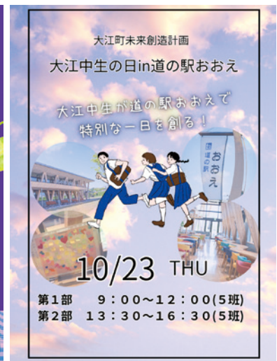
大江中学校 大江町未来創造計画