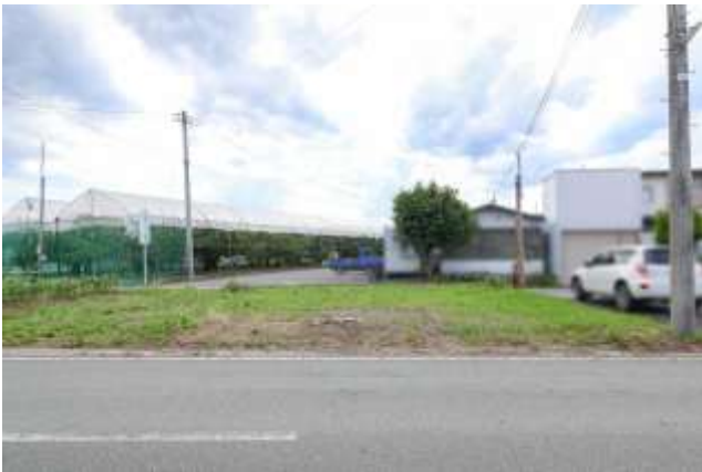
↑ 東側の県道から見た様子。