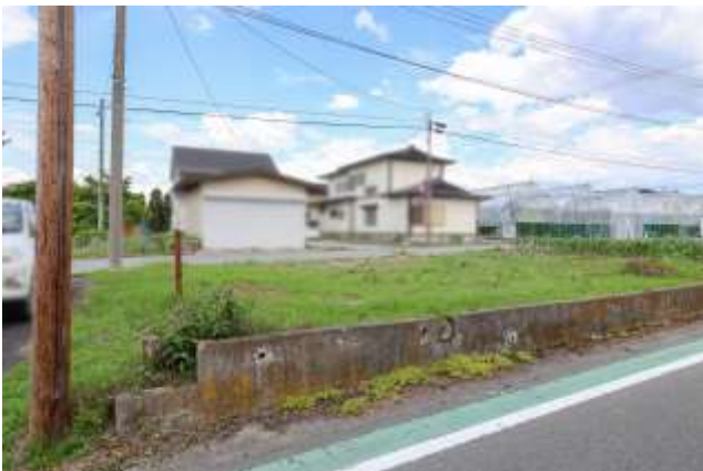
↑ 西側にはコンクリートの段差があります。