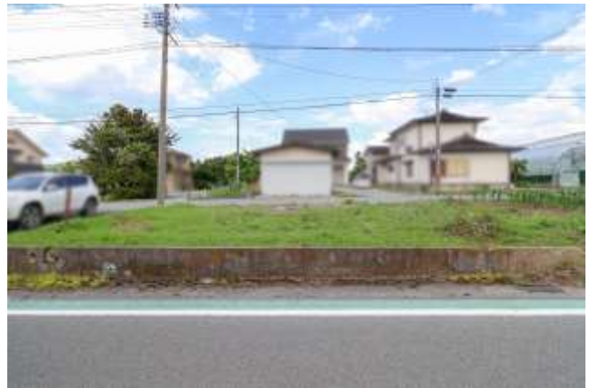
↑ 西側の町道から見た様子。