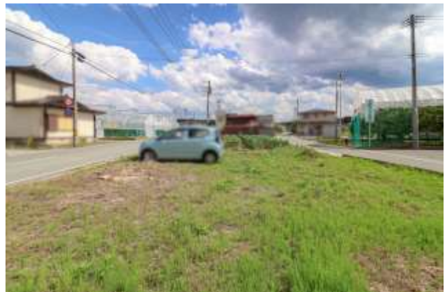
↑ 北側から。敷地の形はほぼ四角です