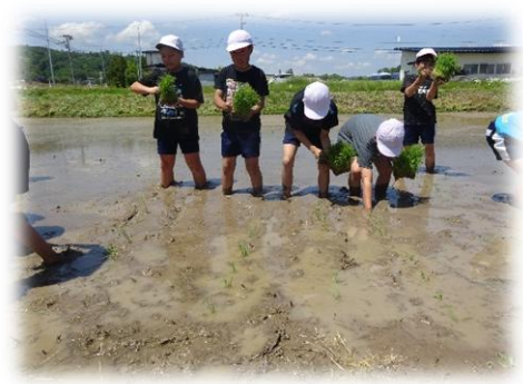
5年 田植え(手植え)体験