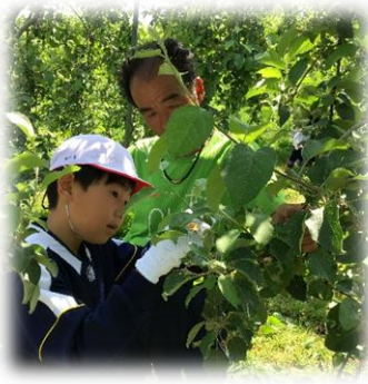
3年 りんごの摘果作業体験