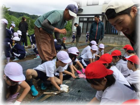
各学年 学校畑へ苗の植え付け

本校では、毎年、地域の先生方に、農作業体験へのご支援をいただいています。今年度も各学年で春の農作業体験を行い、たくさんの地域の先生方が児童に詳しい説明や、あたたかいアドバイスをしてくださいました。児童は笑顔とともに作業に取り組んでいました。夏の成長と、秋の収穫を全員が楽しみにしているところです。