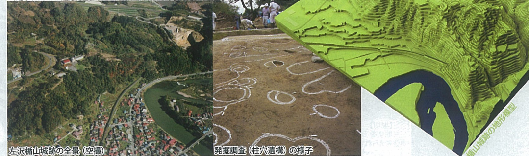
左沢楯山城跡の全景(空撮) 発掘調査(柱穴遺構)の様子

山 城は名前のとおり山の地形を利用した城です。平坦面とがけ(曲輪・切岸)や堀切・虎口といった防御構造を、敵が攻めづらいよう工夫して配置しています(城の縄張り)。また、左沢楯山城跡の「寺屋敷」が檜沢沿いの主要街道を通る人に見せる場所でもあったと推定されるように、左沢楯山城の堅固な守りを最上川などを通る人に見せつける、「攻めたくない」と思わせる抑止力の面からも、最上川や交通の要所を押さえてきた城だったと考えられています。当時山城をつくるための大規模な土木工事には、大変な労力が費やされたことでしょう。そのような犠牲を払って築かれた城は、その時代、領内に暮した人々の命を戦から守るための巨大な施設でした。