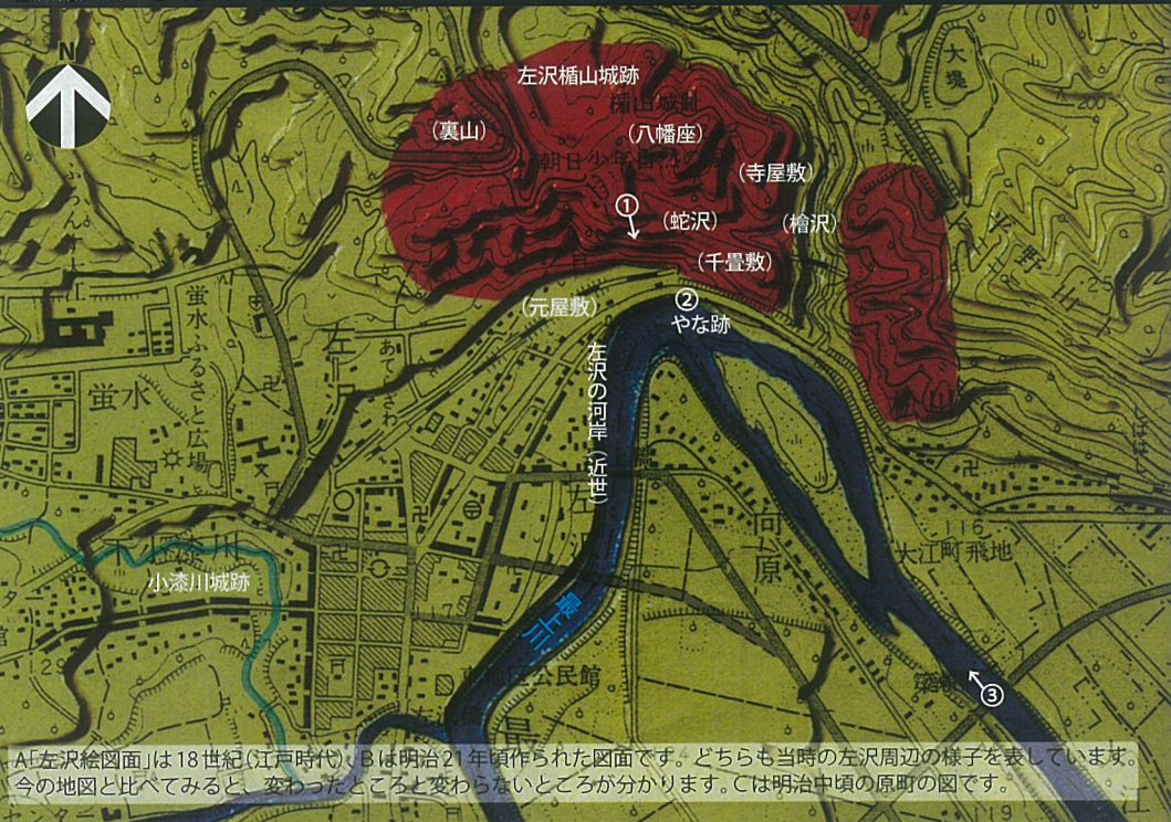
A「左沢絵図面」は18世紀(江戸時代)、Bは明治21年頃作られた図面です。どちらも当時の左沢周辺の様子を表しています。今の地図と比べてみると、変わったところと変わらないところが分かります。Cは明治中頃の原野の図です。