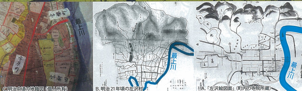
C 明治中頃の地籍図(個人所有) B. 明治21年頃の左沢村 A. 「左沢絵図面」(町内の寺院所蔵)

左 沢楯山城跡が大江氏のお城として機能していた中世は、城(楯山)のすぐふもとから最上川にかけて「元屋敷」周辺に人々の住む居館があったと考えられています。中世の戦国時代が終わり江戸時代に入ると、酒井直次が「小漆川」に城を築きました。そして今の左沢の町中にあたる場所で町割りを行いました。これが近世も継承され、現在の町につながっています。その間、町は東西南北につながる交通の要の地であったと考えられています。中世～近世～近代、そして現代といった町の移り変わりに思いをはせながら、楯山公園から町並みと最上川を眺め、通り過ぎていった人を思い町中を散策すると、町の新しい表情と出会うのではないのでしょうか。