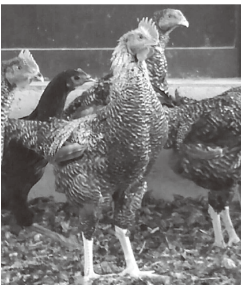
元気に飼育されている山形地鶏