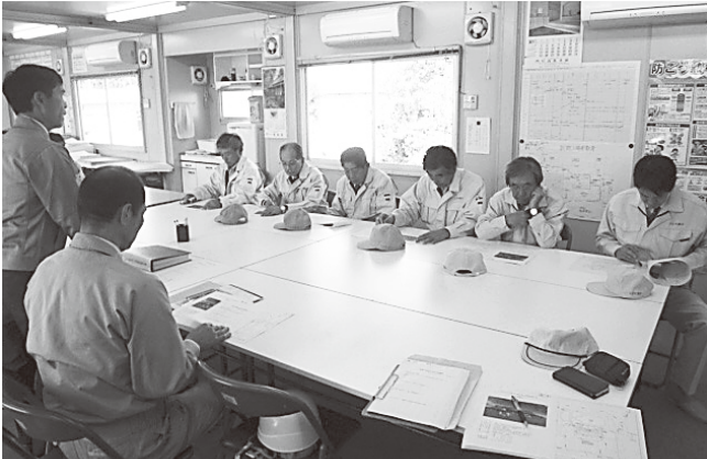
関係者から説明を聞く委員

設計・管理者と施工業者から、工事の進捗状況や来年度6月完成に向けて順調に推移していることを確認しました。