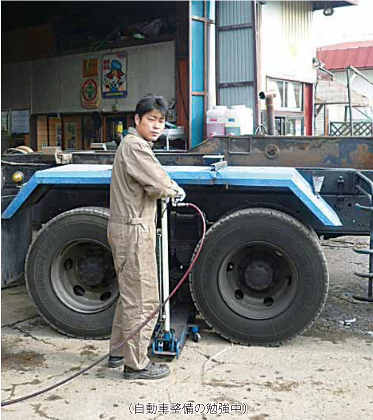
(自動車整備の勉強中)