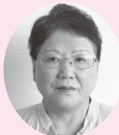
大江町固定資産評価審査委員