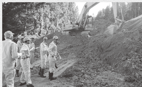
町道中の畑線災害復旧工事 建設水道課