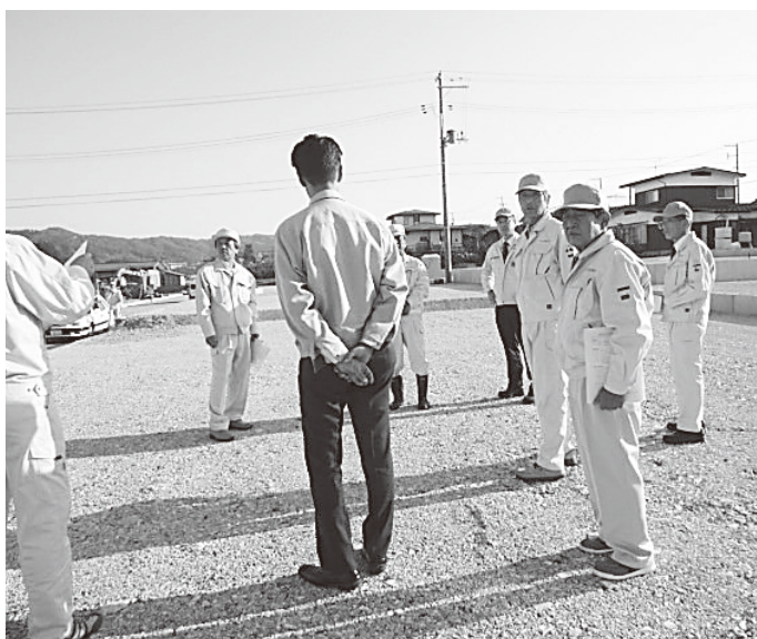
現場の説明を受ける委員

定住人口の増加を目的に藤田地区に造成してきた新しい住宅団地が間もなく完成し、分譲申し込みの受け付けが11月1日から開始されました。 約72坪～100坪の20区画。分譲予定価格は、最多価格帯で坪当たり5万4千900円となっています。 人口減少への歯止め策として期待されています。