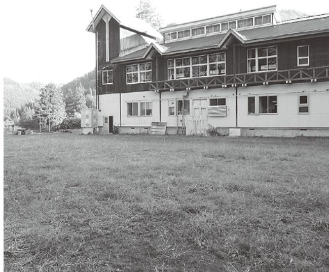
キャンプ等に支障をきたす水はけの悪いグラウンド