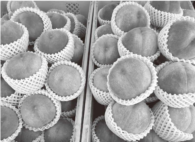
ふるさとまちづくり寄附特典で人気のある町産もも