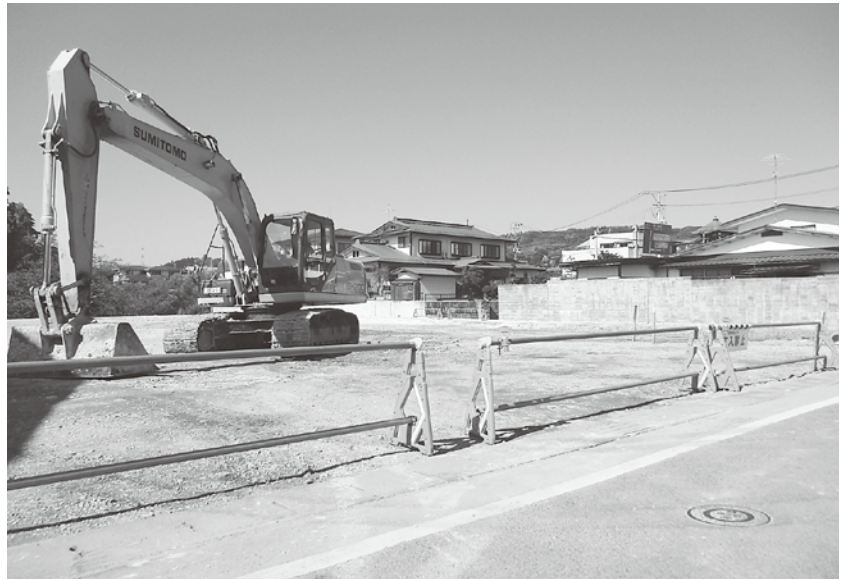
さくら福祉グループホーム大江工事現場(平成28年4月1日オープン予定)