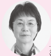
大江町教育委員会委員