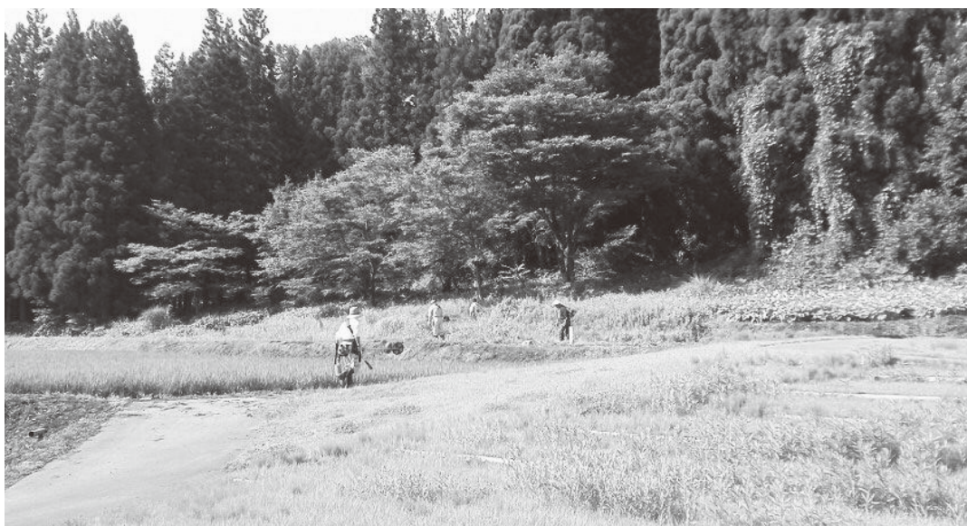
小倉交流館裏側の南ぜき土手草刈り光景

農林課長 大江地域で広域活動協定を結んでいる組織(改良区、伏熊、植山区等)に対し交付するためです。