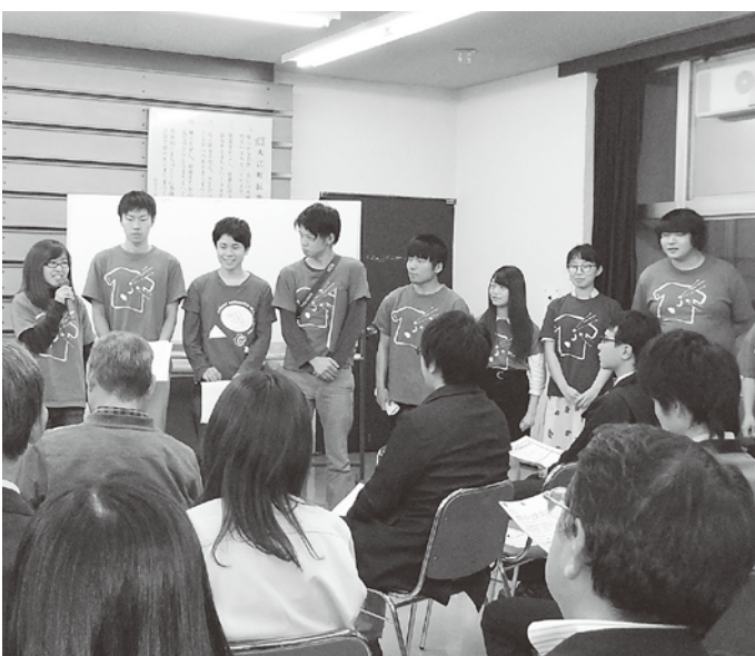
町民とともに町づくりを考える芸工大生