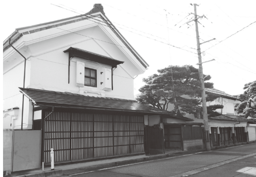
美しい景観を見せる町場の蔵

る1/4を受益者が負担しますが、県の限度額を超える部分に対し、町の負担が発生しますので、その部分への充当を予定しております。