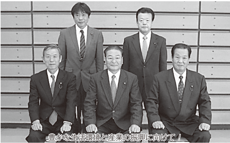
豊かな生活環境と産業の振興に向けて!