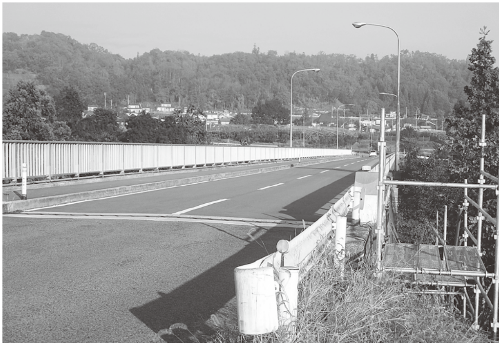
大規模な補修工事となる大江大橋（三郷から富沢方面）