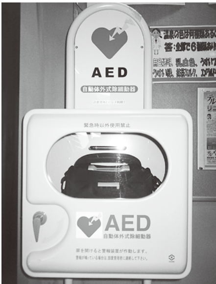
AED（自動体外式除細動器）

政策推進課長 特典制度にまだ満足していないので、新商品の組合わせなどをさらに検討していきます。