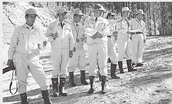
貫見御館山治山工事 農林課 県営事業