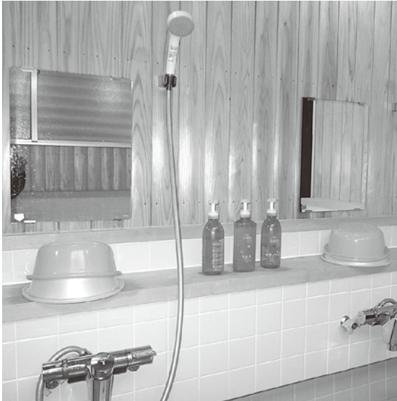
灯油方式に換えるシャワー設備