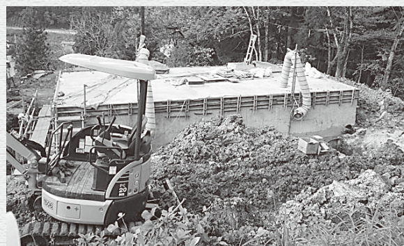
長畑配水池耐震補強工事 建設水道課