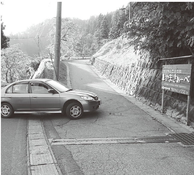
急カーブ傾斜の入口