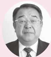
大江町教育委員会委員