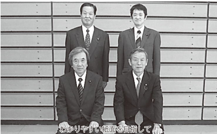
わかりやすい紙面を目指して!