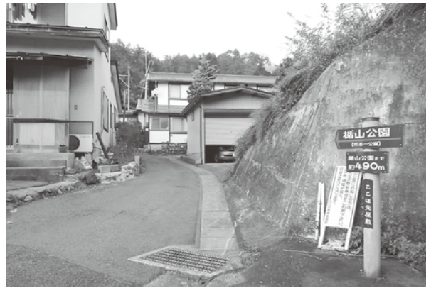
火災が発生した地域の入り口

質問 波切不動尊に行くコースとして、百目木の民家裏を通っていたが禁止された。観光客への影響は。 教育長 波切不動尊は国の重要な文化的景観の要素の一つであるので、道路の部分とは切り離れた立場で、教育委員会としても力を入れていきたい。