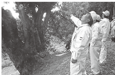
枝折れ状況を確認

総務文教常任委員会では、議会構成後、閉会中の行政調査の議決に基づき、10月21日に町内の工事の進捗状況を調査視察しました。視察箇所は、今年度から2か年継続事業として取り組んでいる中央公民館改築工事、雪害により枝折れした神代カヤ、楯山公園の展望地の整備状況、間もなく分譲申し込みを受け付ける藤田地区住宅団地などです。