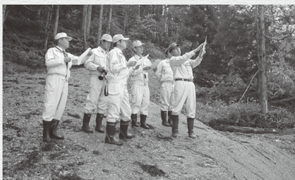
中の畑治山工事 農林課 県営事業