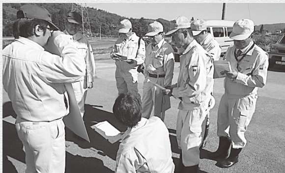
深沢最上堰首頭工改良工事 農林課 県営事業