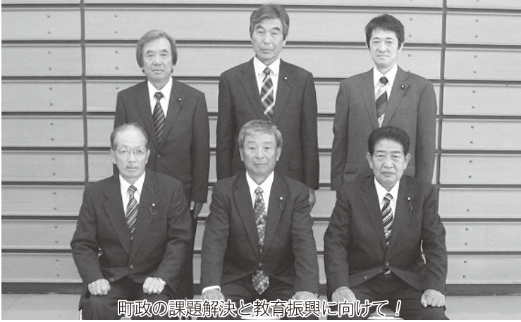
町政の課題解決と教育振興に向けて!

議会活動の広報広聴と、議会活動に対する町民の皆様方からの意見の聴取に関すること等を担当します。