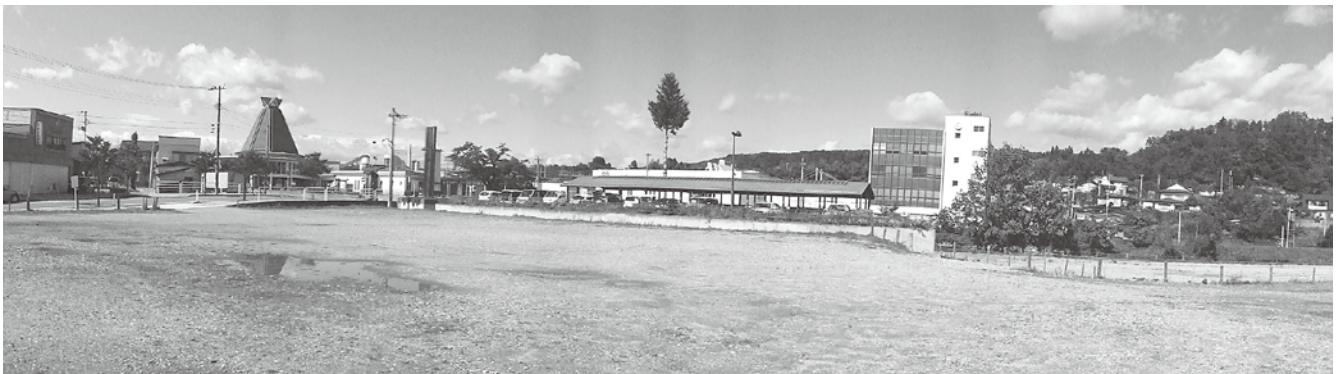
町民の憩いの場となる建物が欲しい駅前公有地