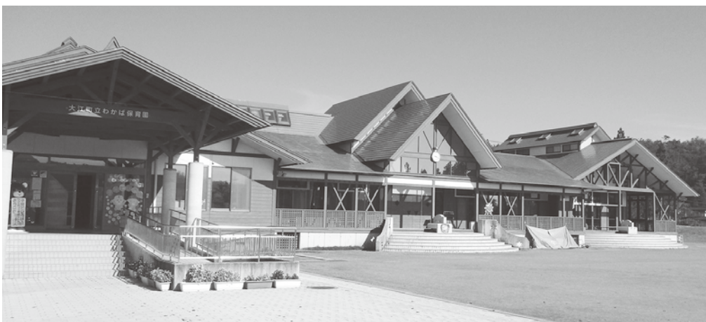
平成30年に統合となるわかば保育園