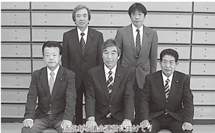
活気ある議会運営に向けて!