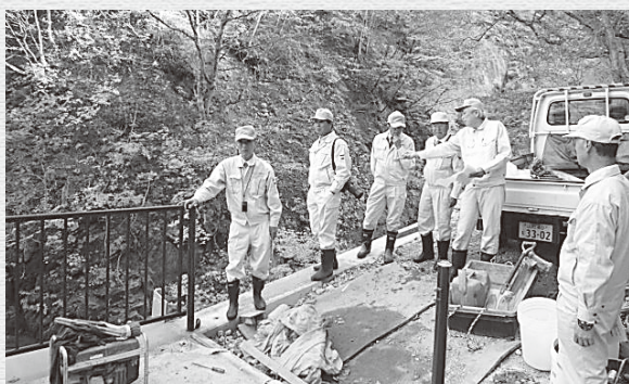
古寺神通峡線災害復旧工事 建設水道課