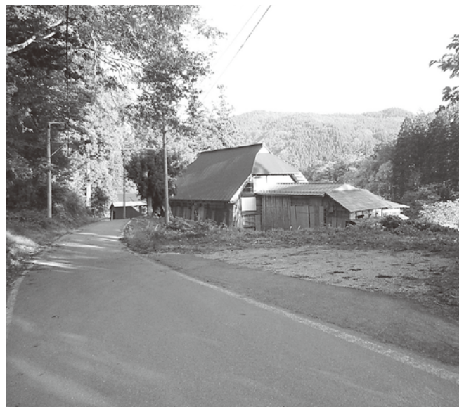
大型バス等がUターンしている民地

町長 現在の道路では危険を伴いますが財源を伴うものであり、早期にできるか検討していきます。Uターンの土地については、民地の借上げなどを考慮し対応していきます。