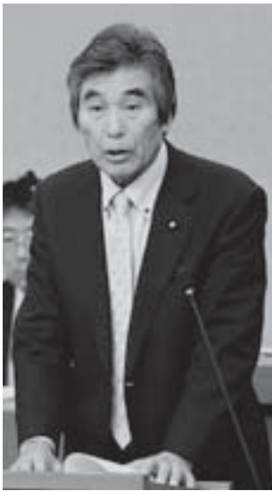
松田 敏男 議員