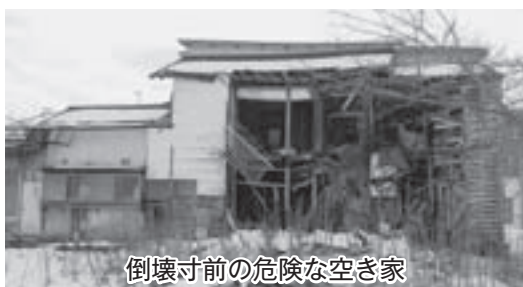
倒壊寸前の危険な空き家

リフォームすれば使える空き家も多くあります。町の空き家バンクにも18軒の登録がありますがなかなか、借り手がない状況にあります。 今後も空き家は増えてくると思われますが、景観はもとより防犯の面でも多くの問題を抱えています。 町としてもさらなる対策を講ずる必要があります。