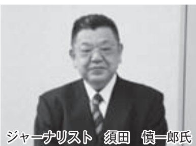
ジャーナリスト 須田慎一郎氏