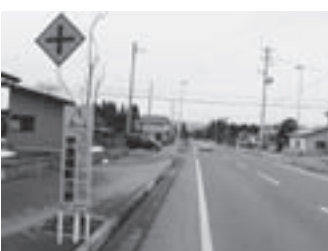
安全協会が設置した看板