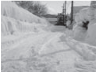
大雪時の除雪状況

間口への寄せ雪を少なくするようできる限り丁寧な作業を心掛けているものの、住民や居住地域の皆様にお願いせざるを得ない現状にあります。町道除雪においても、今まで以上に圧雪時の路面整備や、交差点付近に堆積した雪の除去、幅だしや排雪作業を行い、安全・安心な道路交通の確保に努めていきます。