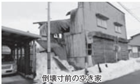
倒壊寸前の空き家