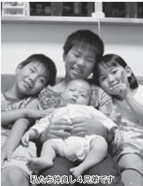
私たち仲良し4兄弟です