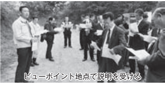
ビューポイント地点で説明を受ける

総会の前に、朝日町白倉地区と大江町古寺地区に通じる大規模林道に接続する「民有林林道伏辺山林道」のビューポイント地点を視察し、雄大な朝日連峰を眼下に視察しました。