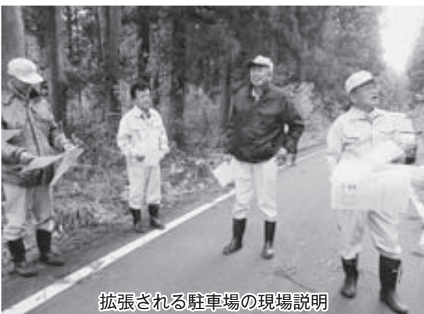
拡張される駐車場の現場説明