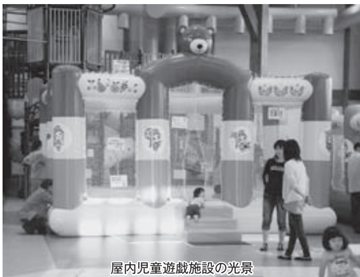
屋内児童遊戯施設の光景