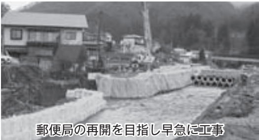
郵便局の再開を目指し早急に工事

濁流を目前にした貫見郵便局も周辺一帯の地すべりによる地盤の不同沈下により、局舎建物自体の損壊や建物周辺に亀裂が見られました。