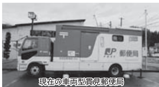
現在の車両型貫見郵便局

が今年度末で完了することから、早急に以前と同様の機能を有する郵便局として再開されるよう、国、県並びに日本郵便に對して要請していきます。