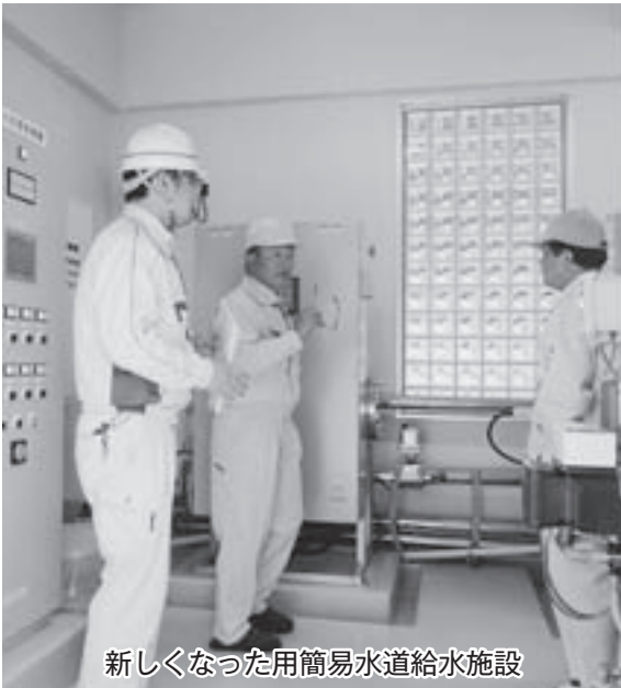
新しくなった用簡易水道給水施設

朝日連峰登山客が古寺鉢泉口を利用している人数は、入山が4,253人、下山が3,884人（平成27年）とほぼ平成26年と同じであります。しかし、駐車場の収容が狭く、年々、すずなりに路上駐車が後を絶たない状況です。 関係機関と早期に調整し、駐車場の整備を望むものです。