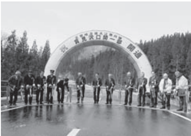
大江西川両町の観光発展を願ってテープカット

平成28年12月26日、大江西川線貫見沢口間の一部開通に伴い、貫見地区において交通安全祈願祭・開通式が行われました。「奥おおえ柳川温泉」や「景勝地神通峡」があり、これらへアクセスする重要な観光路線でもあります。