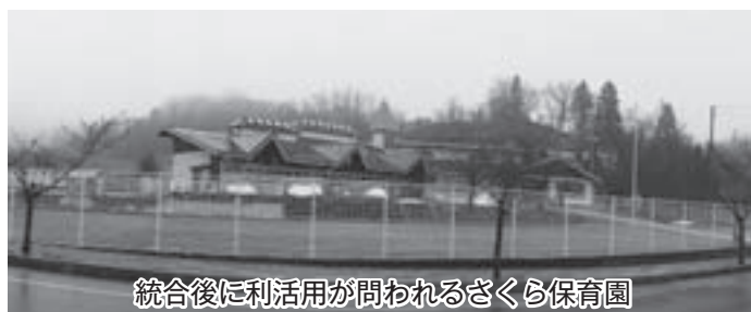
統合後に利活用が問われるさくら保育園

方法については未定ですが、十分に検討したうえで慎重に検討を重ねる必要があります。