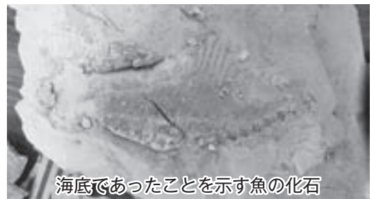
海底であったことを示す魚の化石

り、なかなか解決できずともありません。 しかし、空き家の状況によっては、道路や隣家などに危害を与えてしまうような状況が見られ、何らかの対策を考えるべきだと思えます。