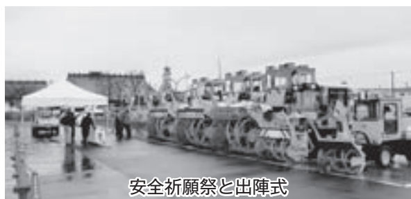
安全祈願祭と出陣式