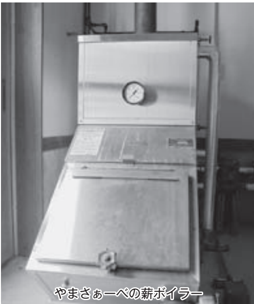
やまさあーべの薪ボイラー