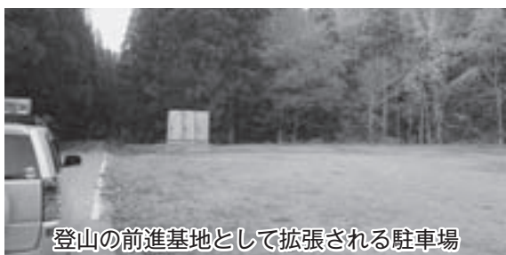
登山の前進基地として拡張される駐車場

町長 新しい施設が担う役割と機能の充実、利用者への利便性を考えますと、必要不可欠なものであり、鋭意、東北電力と調整を進めています。