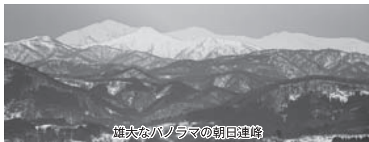
雄大なパノラマの朝日連峰

安全で暮らしやすいコミュニティを「誘導」しなければならぬ時期に来ている。小さいがとてもいい町、共助地域づくりを描かなければならぬ。