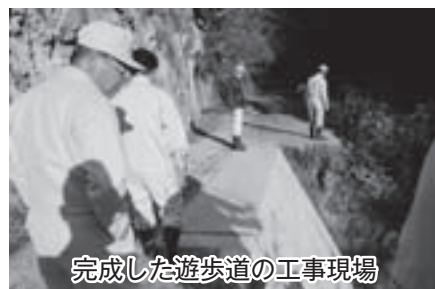
完成した遊歩道の工事現場

平成28年中に完了の予定 であり、平成29年からは待ちに待った大勢の観光客が予想されます。