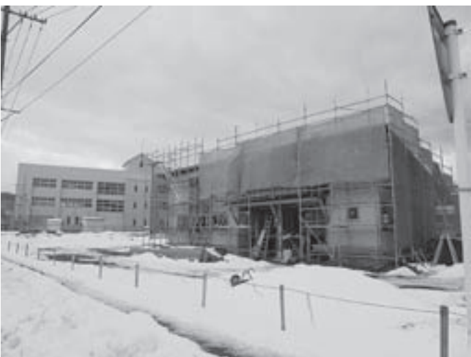
本郷東放課後児童クラブの工事

12月1日、寒河江市役所議場にて開催され、クリーンセンター、斎場特別会計補正予算について、審議が行われました。1,351万円を減額し、予算総額12億4,221万円となりました。