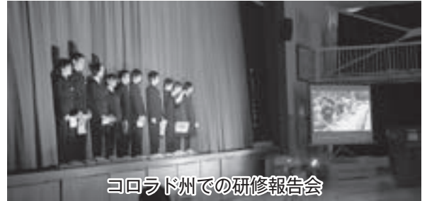
コロラド州での研修報告会

教育文化課長 14人の募集に11人参加となり、自己負担の件を含めて検討していきます。