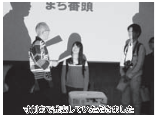
寸劇まで発表していただきました