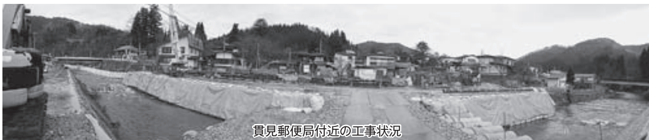
貫見郵便局付近の工事状況

本年4月、地すべりを 起因とする貫見郵便局の 局舎が損壊等により、危 険な状況にあることから、 既存局舎での業務を閉鎖 し、移動郵便車による郵 便業務を行っております。 地域においても、いち早 い貫見郵便局の再開と、 これまで同様の窓口サー ビスの提供を求める声が 日増しに強くなっており ます。 地域住民のメインバン クとしての公共性は生活