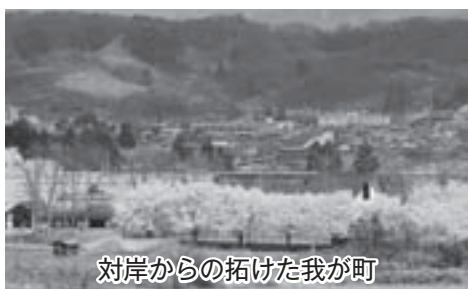
対岸からの拓けた我が町

町長 指定管理制度を導入することは、民間の経営ノウハウを取り入れ弾力性や柔軟性のある施設運営ができます。税収や地方交付税など、一般財源の伸びが期待できない状況下においては、指定管理者制度に移行することでの人件費抑制が図られ、健全財政を維持できるものと理解しており、避けられない情勢であることをご理解願います。