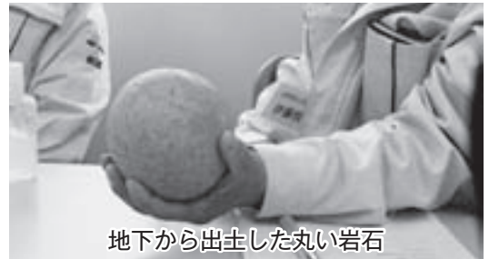
地下から出土した丸い岩石

現在、問題になっている町内の空き家について町内全域を調査しました。空き家については平成24年度の調査では240軒程あり、そのうち、危険と思われる空き家は現在9軒の報告があります。 その中でも、早急に対策をしなければならぬと思われる空き家もありましたが、持ち主が亡くなったたり、相続の問題や解体費用の問題などによ