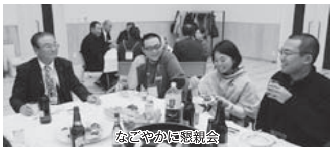
なごやかに懇親会

わってきたことや、これからは、集落や地区ではなく、町全体を考えながら、今後の農業を考えていくことなど、さらには、新規就農者の研修が終わった後の支援体制をどうするのか、10年後、20年後を見据えて考えて行くべきではないかなど、他にも多くの意見が出され活発に意見交換をしました。 今後、本町農業の振興を図るうえで、担い手の育成という観点からも、新規就農研修生及びOSINの会の方々の対話を進めていかなければならないと、認識を新たにしたいです。