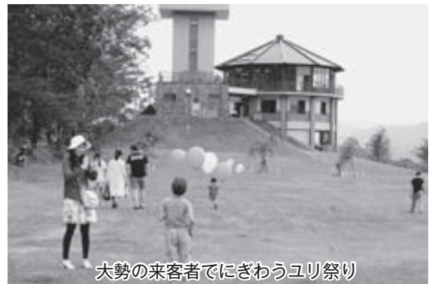
大勢の来客者でにぎわうユリ祭り