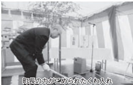
町長の力がこめられたくわ入れ