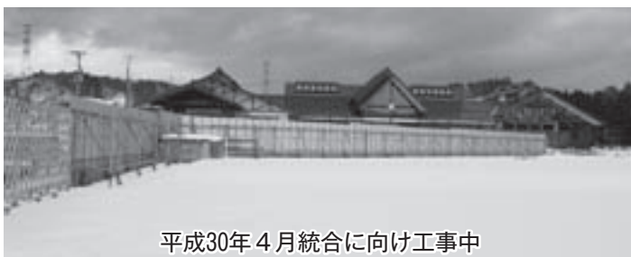
平成30年4月統合に向け工事中