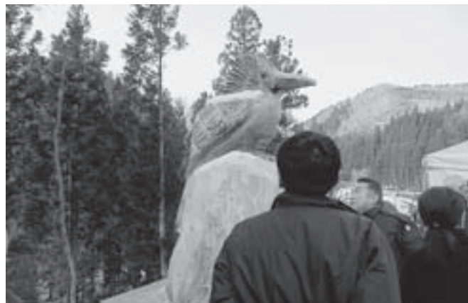
町の鳥『ヤマセミ』の橋梁モニュメント