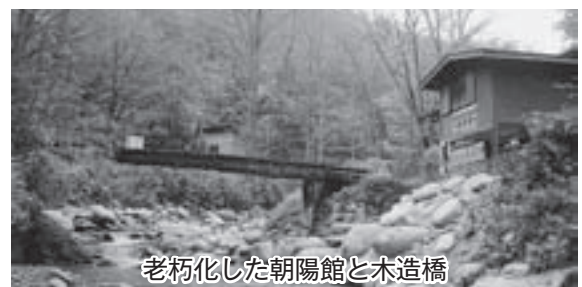
老朽化した朝陽館と木造橋