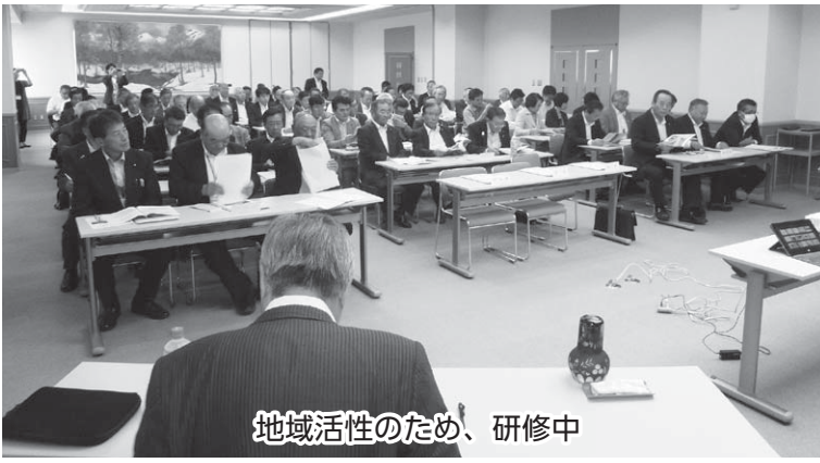
地域活性のため、研修中

講師は、以前JR左沢線のSL運行を企画したこともあり、講演では、「観光の目的は、観光で