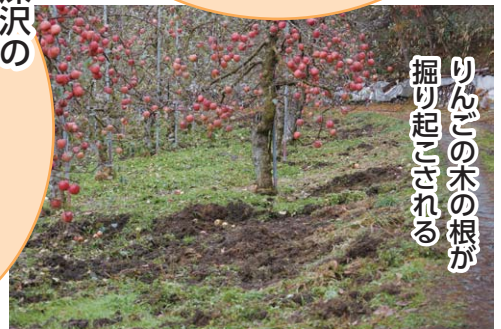
りんごの木の根が掘り起こされる