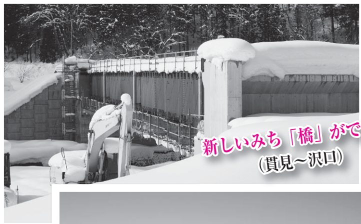
新しいみち「橋」ができる (貫見～沢口)