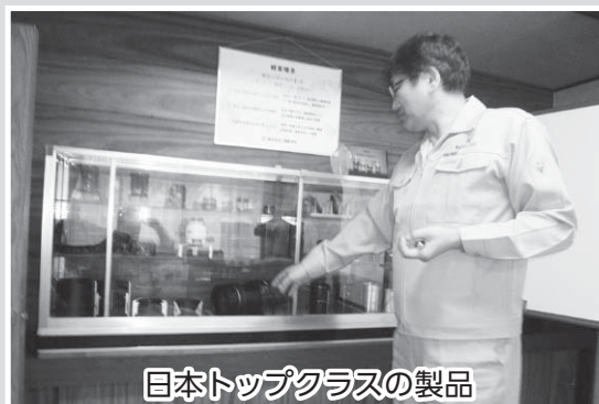
日本トップクラスの製品