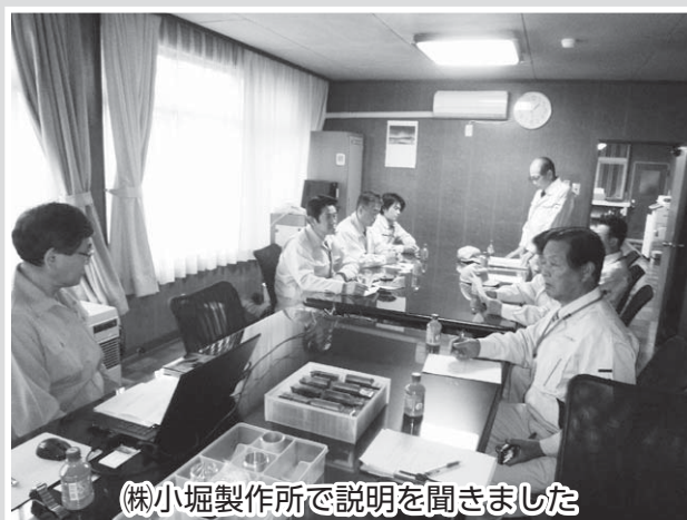
(株)小堀製作所で説明を聞きました