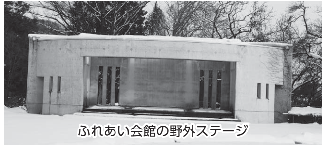
ふれあい会館の野外ステージ

イベント前日の準備においても、屋根がないことから使い勝手が悪いと言われています。屋根ではない飾りのようなものが付いていますが、そのトタンも錆びています。屋根がないことから、雨水で両サイドの鉄製のドアも錆びています。老朽化を防ぐためにも、屋根は必要不可欠です。建設後25年位経ち、近い将来利用しなくなると考えれば別だが、今後でも活用し維持していくので