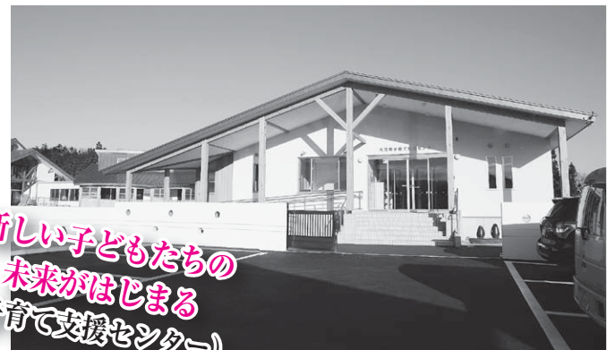
新しい子どもたちの 未来がはじまる (子育て支援センター)