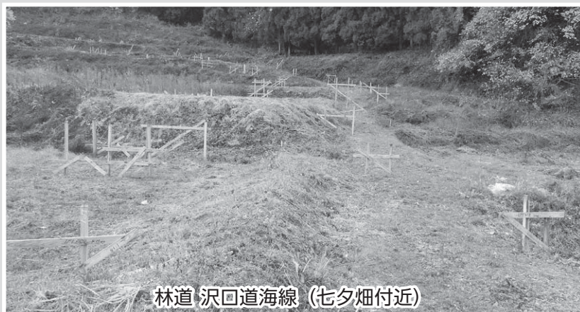
林道 沢回道海線（七夕畑付近）