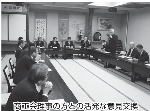
商工会理事の方との活発な意見交換

まちづくりの一翼を担っている商工会理事の意見が活発に出され、町の活性化に対するお互いの考えを出し合い共に進むこと、毎年懇談会を開くことで一致しました。