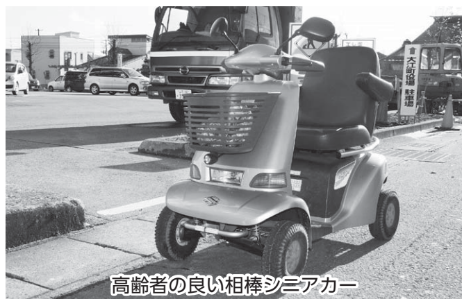
高齢者の良い相棒シニアカー

あと15〜20年で、自動運転の車ができるのではないかと。また、玄関の中まで見送りする介護タクシーなども望ましいと考えます。