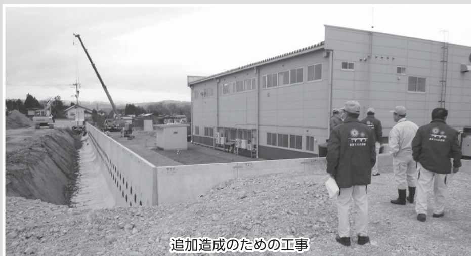
追加造成のための工事

調査 藤田工業団地に造成中の区画の進捗状況を視察しました。造成区画については、本年中の完成を目指し急ピッチで工事が行われていました。また、事業拡大を