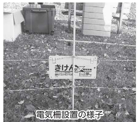
電気柵設置の様子