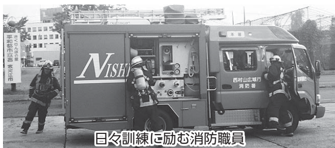
日々訓練に励む消防職員

平成29年10月31日に、消防本部・大平最終処分場・大山前進基地局・明鏡荘・斎場・クリーンセンターの各施設を周り、現在の状況を視察、説明を聞きました。