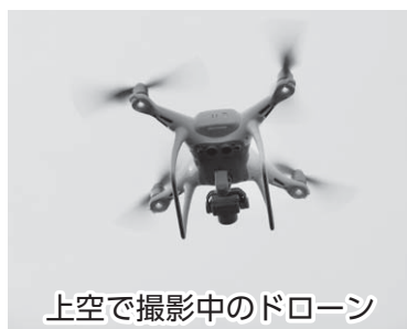
上空で撮影中のドローン