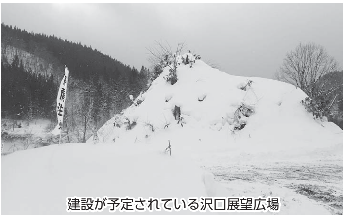
建設が予定されている沢口展望広場

今後については、学習指導要領の改訂もあることから、小中学校の教育について、どう進めていくか検討していきます。