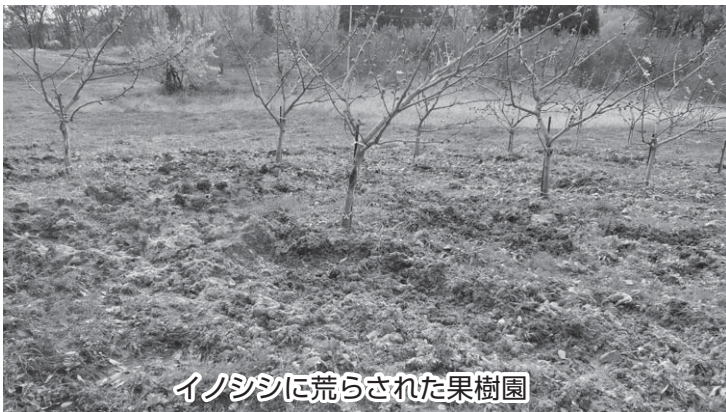
イノシシに荒らされた果樹園