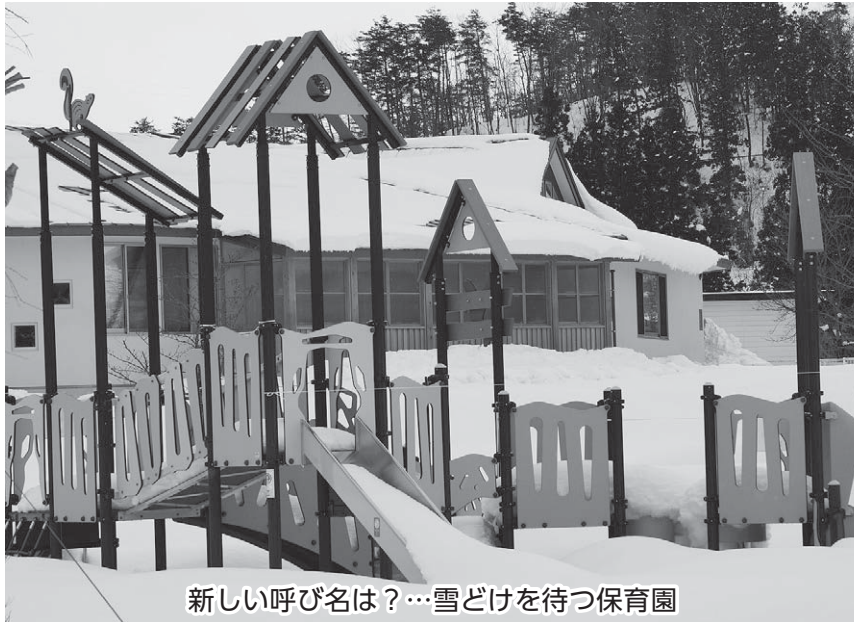
新しい呼び名は？…雪どけを待つ保育園

名称の由来については、大江町の象徴である朝日連峰をイメージしたものであり、高く険しい山並みを表す峻嶺が、朝日連峰の厳かな姿を表現しており、しっかりと地に足をつけ、高い頂きを目指して伸びゆく子どもたちを、力強く見守っていくイメージを表現しています。