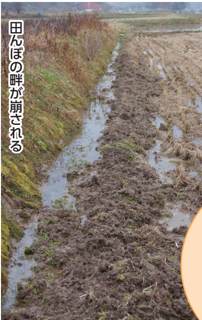
田んぼの畔が崩される