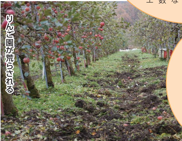
りんご園が荒らされる

りんご園が掘り起こされ、草刈り機やスピードスプレヤーの作業ができなくなってしまう。