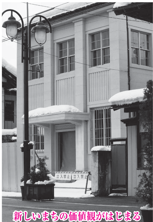
新しいまちの価値観がはじまる (きらやか銀行跡地)