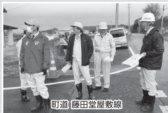
町道 藤田堂屋敷線