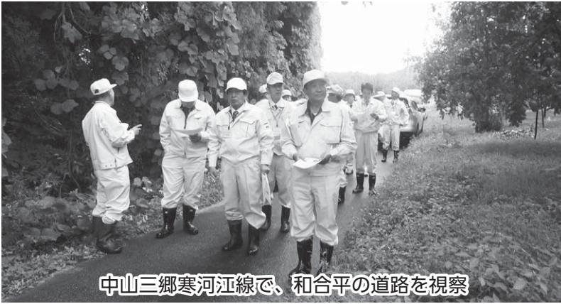
中山三郷寒河江線で、和合平の道路を視察

総会では、両町の共通課題である観光道路の整備、一般県道の整備促進、鳥獣被害の3点について意見交換が行われました。特に鳥獣被害については、イノシシの分布が拡大して被害が増えており、両町連携して緊急の対策が必要との認識で一致しました。