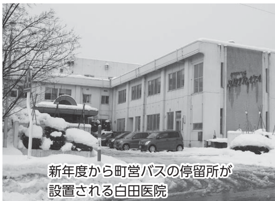
新年度から町営バスの停留所が 設置される白田病院