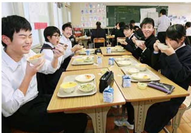
▲大江中学校の給食風景。ひと味違う献立を楽しく味わっています