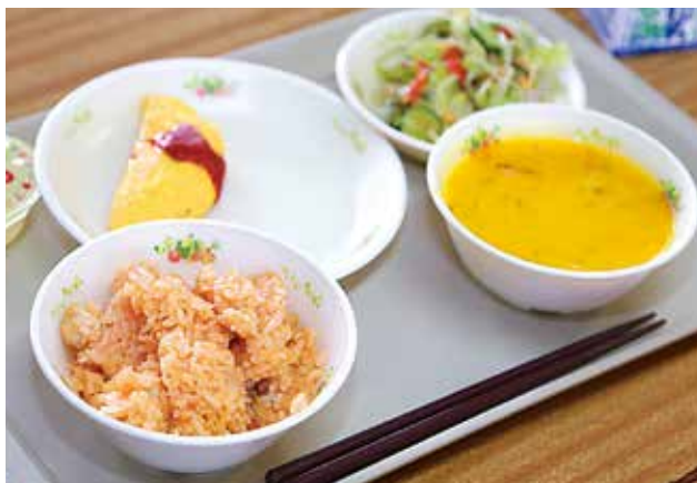
▲左沢高校農業愛好会の生徒が考案した「おめでとう献立」

山盛りのチキンライスなど色鮮やかなメニューを前に、子どもたちの気分も高揚気味。香りも食欲をそそる特別な給食を、おいしそうに味わっていました。