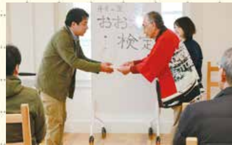
▲12月8日、検定合格者に石川会長から合格証などが手渡されました