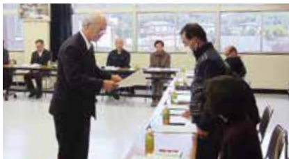
▲12月2日の委嘱状交付式の様子

任期満了に伴い民生委員・児童委員の一斉改選がおこなわれ、12月1日付けで厚生労働大臣より36名の 方が委嘱されました。新しい委員の任期は、令和元年12月1日から令和4年11月30日までの3年間です。