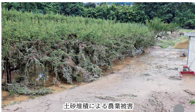
土砂堆積による農業被害