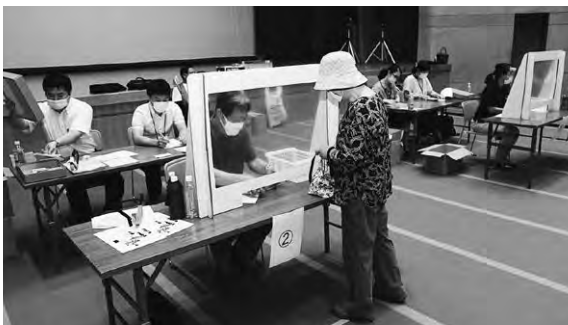
▲商品券での地域活性化が望めます

新型コロナウイルス感染症拡大の影響を受けている地域経済の活性化対策として、「プレミアム付がんばれ大江商品券」が販売され、事前申込者に8月1日と2日に引換がおこなわれました。