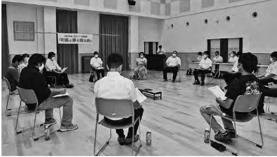
▲活発な意見交換がおこなわれました

今年度のまちづくり座談会の第一弾として、8月20日に若手・新規就農者の皆さんを対象とした「町長と夢を語る会」を開催しました。