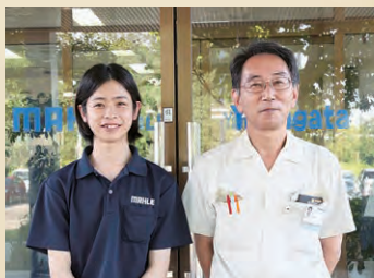
▲右から富樫工場長、高城さん