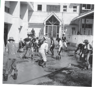
ボランティアの皆さんによる復旧作業。町内外から多くの方が駆けつけてくださいました

7月28日(火)の豪雨は町内各地に大きな被害をもたらし、やあさあーべも被害を受けました。敷地の北側を流れる細い水路が氾濫。グラウンドや体育館下のピロティなどに大量の土砂が堆積してしまいました。7/31~8/2の3日間、インターネットを通じてボランティア(県内限定)を募集したところ、町内外から延べ68名の方が助けに駆けつけてくれました。また救援物資を送ってくださった方や、道具を貸してくださった方もいます。その後の建設業者さんの作業も迅速で、概ね土砂の撤去は完了。完全復旧には至りませんが、何とかお客様をお迎えできる場所までは戻りました。この場を借りて、ご協力いただいた皆さんに心から御礼を申し上げます。本当に、本当に、ありがとうございました。