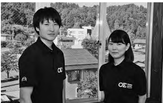
▲涼しげな装いでさわやかな対応を心がけます

町では、今年度新しくクールビズポロシャツを作製し、職員が8月から着用しています。