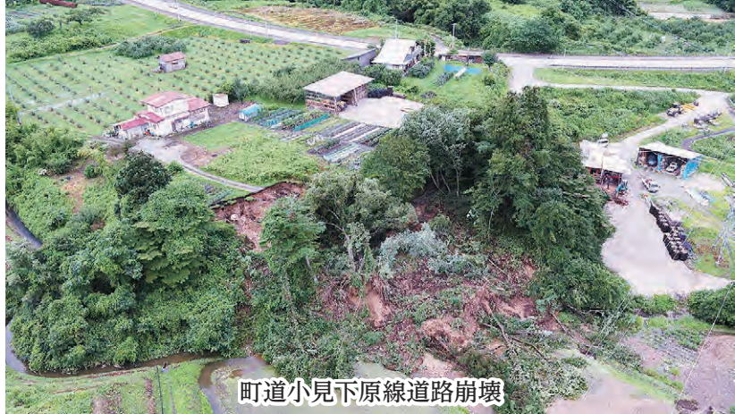
町道小見下原線道路崩壊