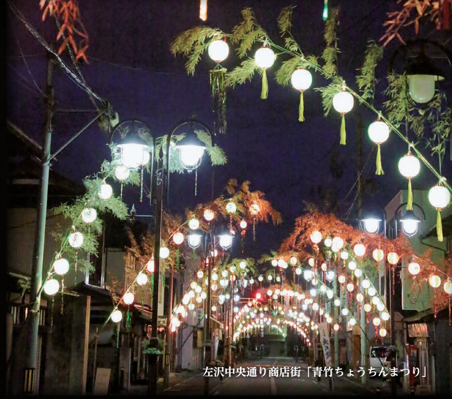
左沢中央通り商店街「青竹ちょうちんまつり」