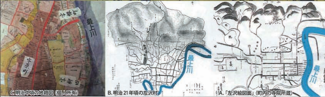
C 明治中頃の地籍図(個人所有)