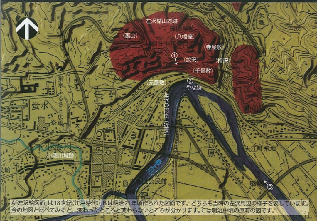
A「左沢絵図面」は18世紀(江戸時代)、Bは明治21年頃作られた図面です。どちらも当時の左沢周辺の様子を表しています。今の地図と比べてみると、変わったところと変わらないところが分かります。Cは明治中頃の原野の図です。