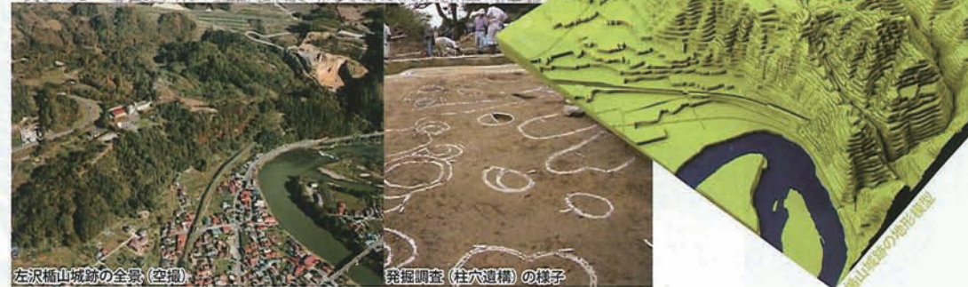
左沢楯山城跡の全景(空撮)