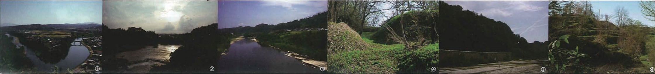
①楯山公園から眺めた最上川(右側が上流です) ②楯山ふもとのやな跡 ③最上川下流から楯山を望んだ様子 ④城内の防御構造(堀切周辺) ⑤川から眺めた楯山城跡(人が立っている岩盤部分は通常水が流れている場所です) ⑥「段々畑」のように曲輪が連なる様子

中世～近世～近代、そして現代といった町の移り変わりに思いをはせながら、楯山公園から町並みと最上川を眺め、通り過ぎていった人を思い町中を散策すると、町の新しい表情と出会うのではないのでしょうか。