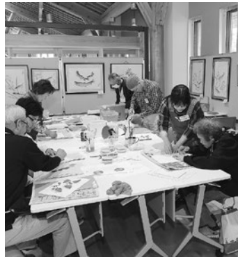
▲色彩魚拓作品展示と体験コーナー