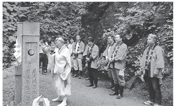
▲不動明王像前でおこなわれた安全祈願祭

秋には紅葉の神通峡を楽しめるイベントを実施する予定となっており、このたびの復活を契機に、より多くの方が神通峡や周辺観光施設を訪れることが期待されます。