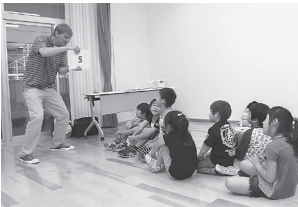
▲遊びながら楽しく英語に触れる講座「Happy Happy English」。「わくわく学部」の講座のひとつです

町教育委員会では、これまでの生涯学習事業をリニューアルし、おおえ町民大学「ぷくらすカレッジ」を今年度から開始しました。