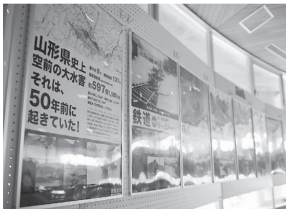
▲県内各地に深い爪あとを残した「羽越水害」の記録を伝える、50周年巡回パネル展

二次災害の有無などについて知っておくことが、適切な行動をとるための大切な判断材料となります。