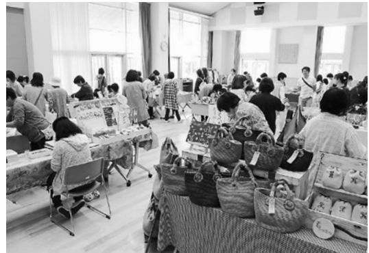
▲たくさんのブースが並び、多くの来場者でにぎわう町民ホール