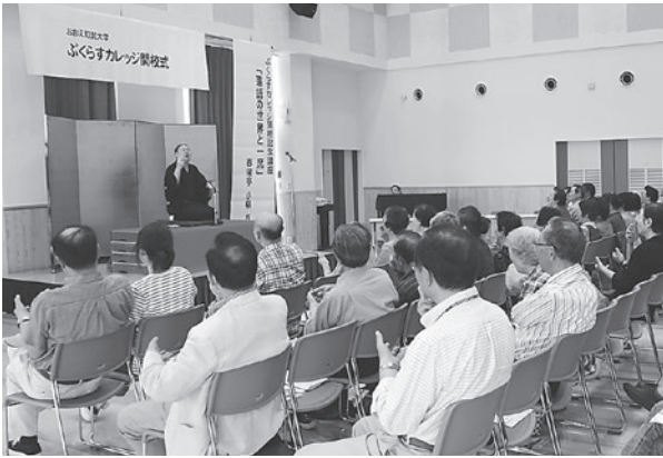
▲落語家の春風亭小柳さんによる開校記念講座