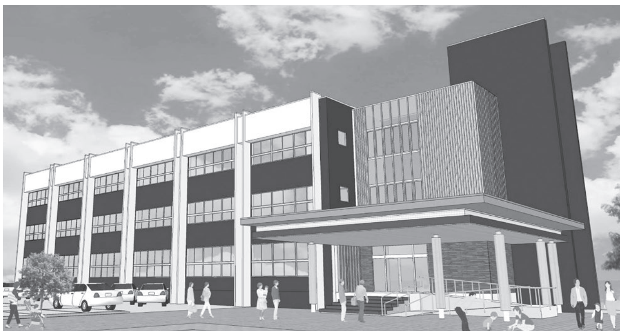
▲役場庁舎エレベーター完成後の、庁舎外観予定図。現在の正面玄関部分にエレベーターを設置するための棟が新たに設けられ、外観が大きく変わります。また、玄関東側に新しいスロープを設置する予定です

役場庁舎へのエレベーター設置工事が、6月19日から始まりました。庁舎のエレベーターは、町民の皆さんのほか役場を利用される方々、特に高齢の方がより利用しやすいよう、庁舎のバリアフリー化を推進するために整備するものです。