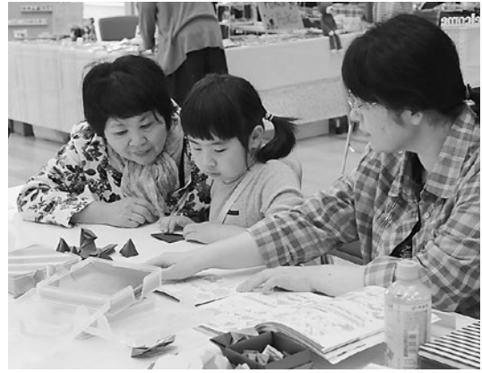
▲折り紙でいろいろな動物作りに挑戦

会場では色彩魚拓や陶芸、アクセサリーや折り紙など、実際に工芸作品の制作を体験できるコーナーもあり、たくさんの家族連れや子どもたちが、自分だけの作品作りを楽しみました。