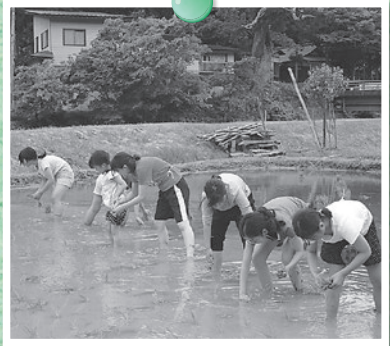
▲福島の子どもたちと田植え

昨年からは福島などからお客様をお迎えして、田植えや稲刈りなどの体験活動をおこなっています。今年はやまさあべに強力なスタッフが入ってくれたこともあって、昨年よりも耕作する面積を約3倍に増やしての活動がスタートしました。私が柳川で田んぼをやっている理由は、大きく分けて2つあります。1つは「耕作放棄地」という地域がかかえる問題の解決に、少しでも私の活動を役立てたいということ。そしてもう1つは、ホテルをはじめとする田んぼの生きものたちを増やすことです。きれいな水でつくるとおいしいお米はもちろん地域の資源ですが、ネイチャーガイドの立場からすれば、そこにさまざまな生きものが住めることは、それと同じくらい魅力的な観光資源といえます。だから、少々大変でもできるだけ農業は使わないし、今年は実験的に「不耕起田んぼ＝耕さない田んぼ」なんてこともやっていたりします。そんな一風変わったことができるのも、地域の方々のご理解とご協力があってこそです。