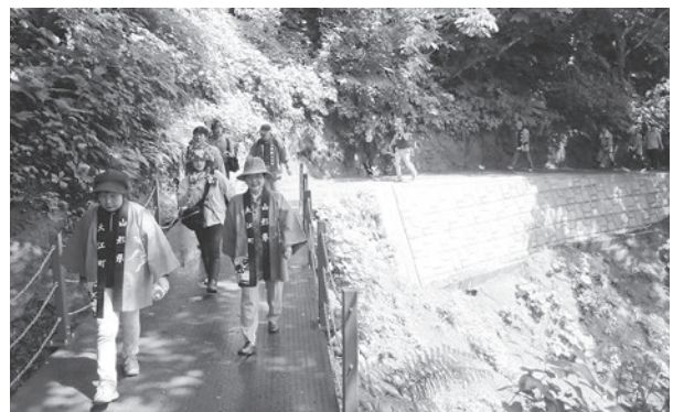
▲修復工事が完了し、通行が可能になった遊歩道