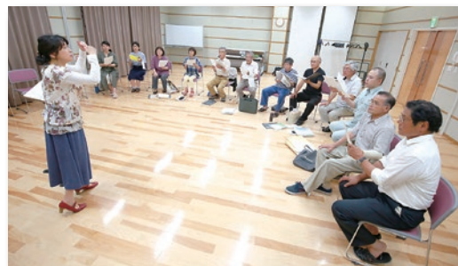
▲文化祭に向けての練習風景。4つのパートが重なりあい、美しいハーモニーが生まれます