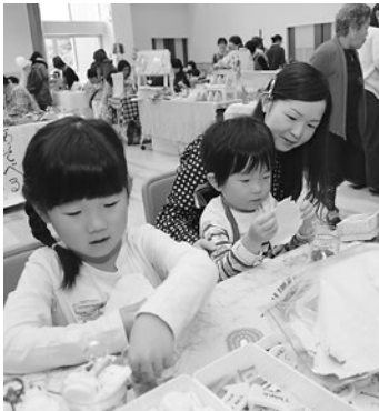
▲布などでデザート風の小物を作るコーナー