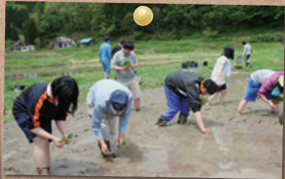
柳川平区にある水田で大学生が田植を体験

まもなく左沢高校生との企画で、町の魅力をPRするVTR「大江町TV」の制作も始まります。町の温泉施設で上映していく予定ですので、見かけた際はぜひ一服、観てっけらっしゃいなっす!