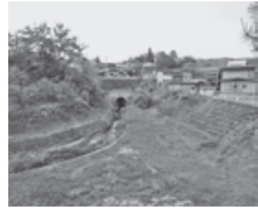
市の沢川を隔てて左が城跡、右が旧城下町