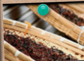
↑ゼンマイ干しの様子