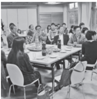
▲中学生海外派遣事業、第1期生11名の皆さん

また、5月19日には事業開始を記念してキックオフパーティーが開催され、参加した中学生は夏のモンタナ州訪問に向けてお互いの団結を誓いました。