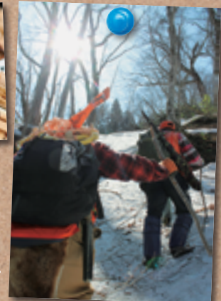
猟友会の皆さんと雪山へ「くまがち」に→