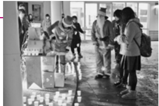
待ち時間中にはダンスパフォーマンスが披露されました▶

訪れた方は「こんなすてきな企画が駅前でおこなわれているなんて」とうれしそうにプレゼントを受け取っていました。