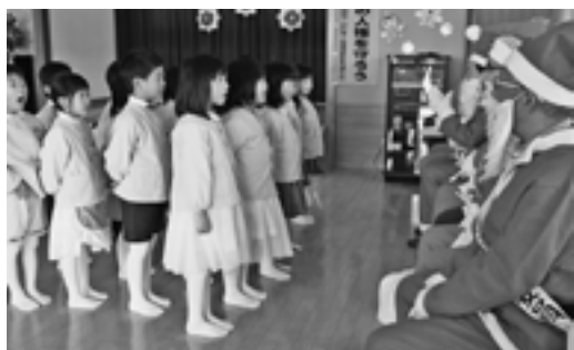
▲人権サンタクロースさんからプレゼントがありました