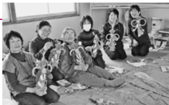
皆さん教え合いながら「縄ない」に挑戦しました▶

わら縄を作る「縄ない」は、わらに2種類のねじりを加えて一本の縄に仕上げていくというもので、参加者はねじる方向に気を付けながら縄を作り、手作りの装飾品や持ち寄ったナンテンやユズリハを飾り付け、立派なしめ飾りを作り上げました。