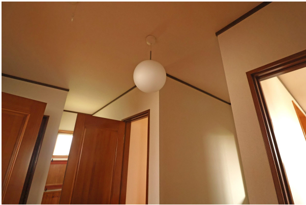
廊下にはかわいらしい照明も。