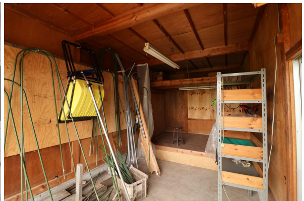
事務所のおとなりには、除雪道具などを保管しておける物置も。