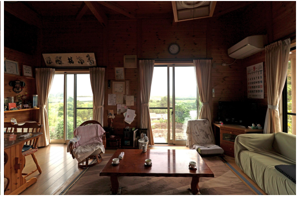
玄関を入ってすぐ右にダイニング＆リビング。 灯ろう流し花火大会の花火を自宅からながめることもできるそうですよ。