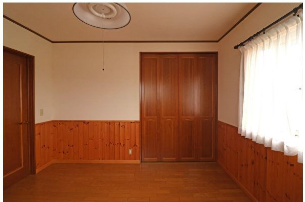
お次は2階へ。2階にもダイニング&リビングやキッチン、浴室、お手洗いもあるため、2世帯で暮らすのにぴったり。 2階のお部屋は2部屋とも洋室です。