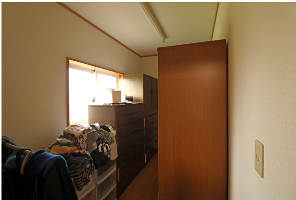
寝室の奥には大きめの収納スペースもあります。