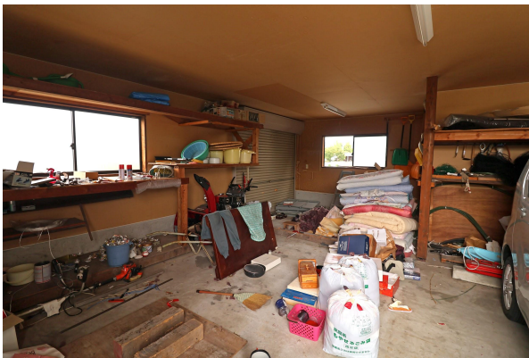
電動シャッター付きの車庫(2台とめられます)もあって便利！