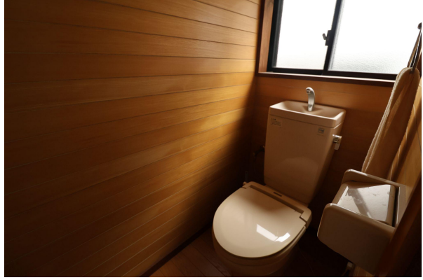
事務所には小さめの冷蔵庫が置けそうな給湯室、お手洗いもあります。