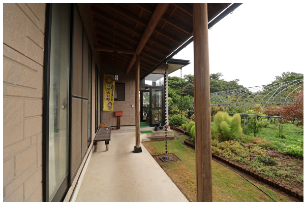
玄関横と縁側。 ベンチに腰かけて花壇の植物を愛でたい。