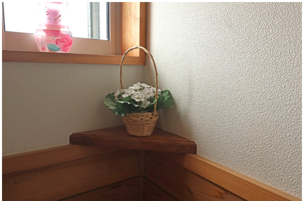
角の飾り棚がチャームなお手洗い。 お気に入りの雑貨や一輪挿しを置きたくなります。