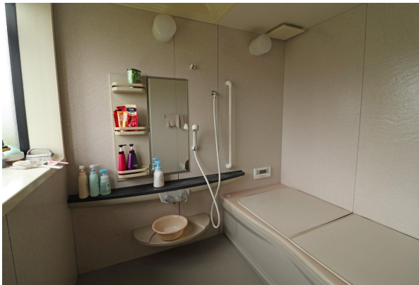
白で統一された、きれいな浴室。