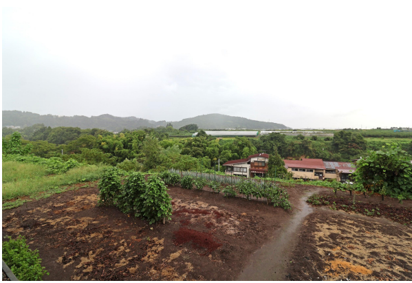
ダイニング＆リビングからは、近所の畑と山々が見渡せます。