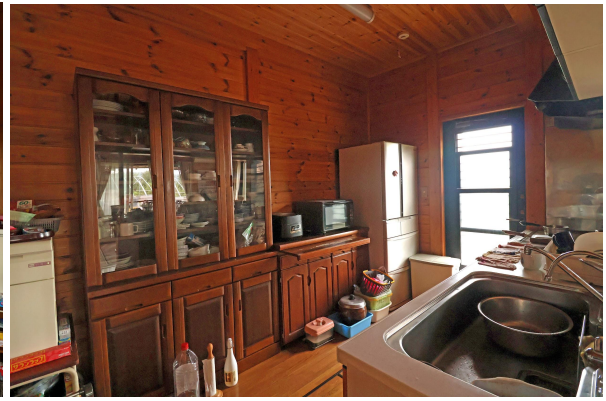
あたたかみのあるキッチン。冷蔵庫や食器棚、調理器具をおけるスペースも広々。