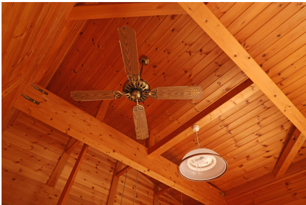
天井には昔ながらの喫茶店にありそうなシーリングファンも。