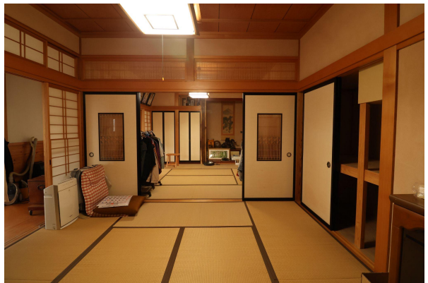
1階には8畳の和室がふたつ。お客さんが来たときや趣味を楽しむお部屋などにお使いください。