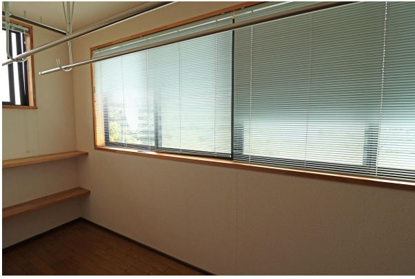
キッチンのおとなりにはサンルーム。備え付けの棚があるのも便利ですね。