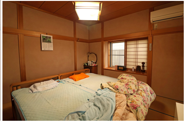
1階の奥、2面採光の寝室では気持ち良く朝を迎えられそう。