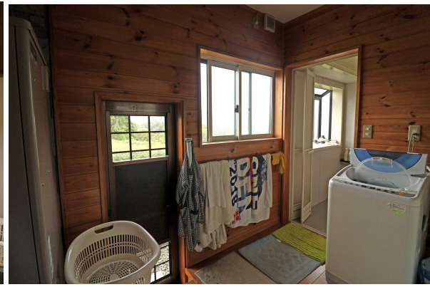
洗面所は洗濯機を2台おけるくらいのスペースがあります。